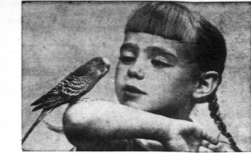
Mergaitė ir papūga

Ar ne tiksliau būtų užrašas: "Čia kalbama lietuviškai" prie namų, kur gyvena, kai kurios, lietuvių šeimos, o ne prie patalpų liuanistinių mokyklų, kaip, kad buvo vieno garbaus lietuvių parašyta mūsų spaudoje. Šis išsireiškimas mokytojams yra labai skaudus, nes per tas trumpas, bet niekuo neįkai-