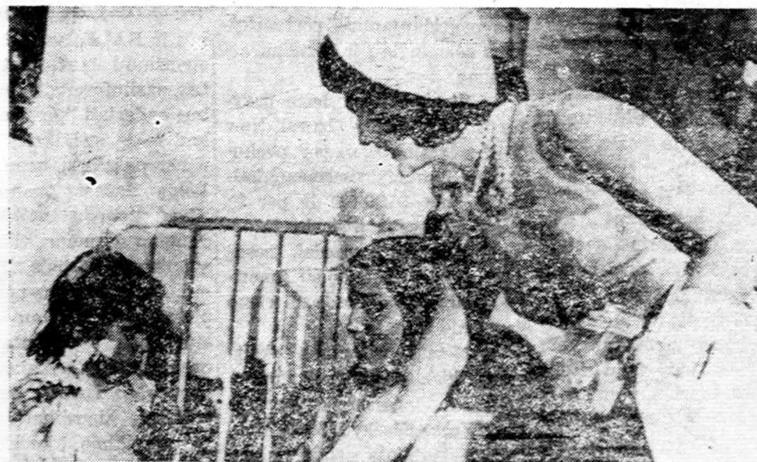
JAV prezidento žmona Mrs. Kennedy duoda ligoniui vaikui saldainį, atvykusi į Indijos medicinos institutą New Delhi, Indijos sostinėje.