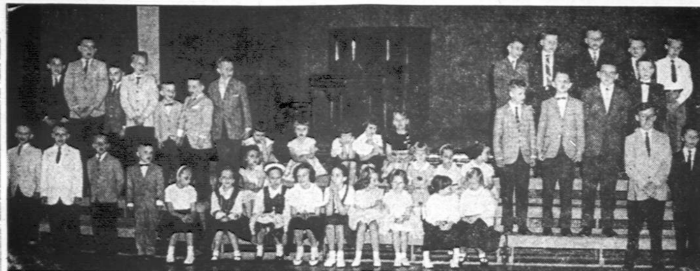
Dalis jaunučių ateitininkų vieno pasitarimo metu šv. Jurgio parapijos salėje Clevelande.

atlieka inž. J. Augustinavičiaus statybos bendrovė.