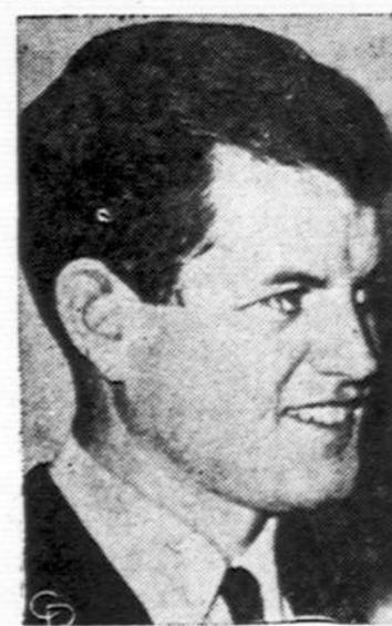
Edward M. Kennedy (demokra- tas), prezidento brolis, kandida- tuoja į JAV senatorius iš Massa- chusetts valstybės. Jis dabar yra apylinkės taryboje Bostono pagai- bininkas.

— Princas Pilypas, Britanijos karalienės Elzbietos II vyras, dabar vizituoja Lotynų Ameri- ką. Kovo 12 dieną jis atvyko į Paragvajų trijų dienų oficia- laus vizito. Jau vizitavo Vene- cuelą, Kolumbiją, Ekvadorą, Pe- ru ir Čilę. Iš Paragvajaus išvy- ko į Braziliją; taipgi aplankys Argentina.