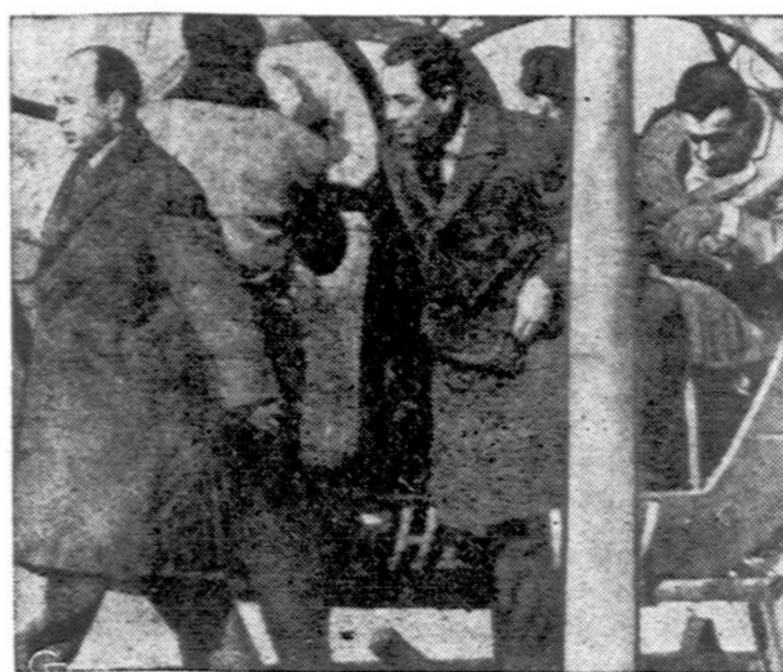
Laikinosios alžirietiškos vyriausybės vicepremjeras Belka- cem Krim (kairėje) palieka helikopterį prie du Parc viešbučio Evian vasarvietėje, Prancūzijoje, skubėdamas į posėdį, kur ban- doma pasirašyti su Prancūzija galutinį karinių paliaubų susitari- mą. Kitą sukilėlių vyriausybės pareigūnai jį seka.

— Mrs. Kennedy, JAV prezi- dento žmona, Indijoje lanko žy- mesnes vietas.