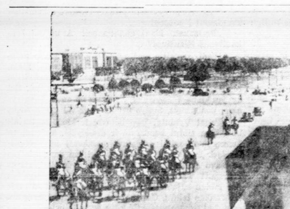
Jacqueline Kennedy stebi Indijos prezidento sargybų parodą nuo valstybės pastato New Delhi mieste. Dešinėj yra Indijos prez. Rajendra Prasad.

Apimoką skelbtis "DRAUGE" nes jie plačiausiai skaitomas lietu- vių dienraštis. Gi skelbimu kainos visiems priimamos.