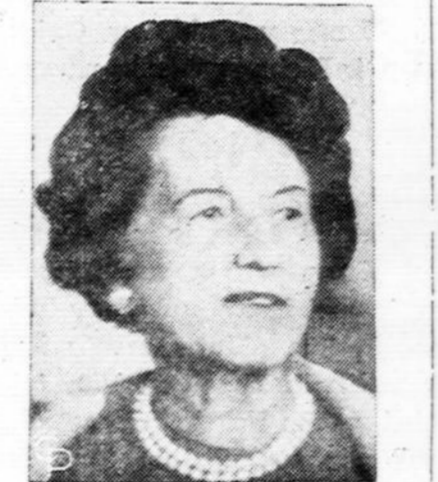
Rose Kennedy, prezidento motina, susirgo ir paguldyta St. Elizabeth ligoninėje Bostone. Ji yra 71 m. amžiaus.