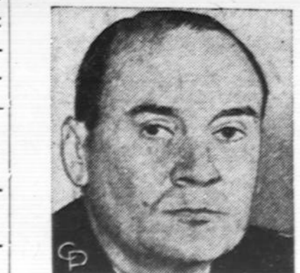
Buvęs generolas Jouhaud, pamerktas už akių Paryžiaus teismo mirti, aukštą slaptosios armijos organizacijos (OAS) Alžirijoje vadovą, areštuotą Orane. Alžirijoje, prancūzų kariu. Prancūzai karaliai Orane ėjo iš namų į namus, ir jie viename name užėjo buvusį generolą.