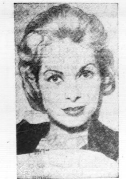
Akt. Janet Leigh, 33 m., New Yorko ligoninėje ištyrė sveikata po to, kai ji sugriuvo vonios kambaryje ir apsidaužė.