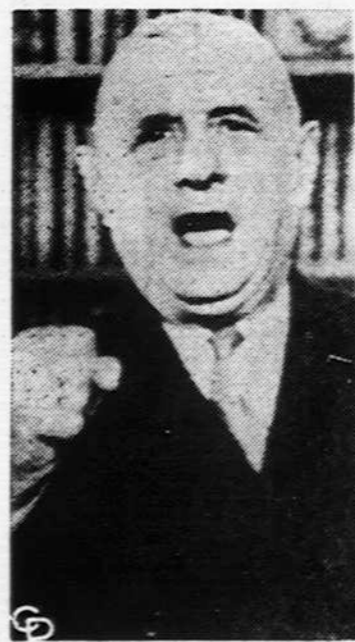
Prezidentas Charles de Gaulle kreipėsi į prancūzų tautą, prašydamas ją balandžio 8 dienos referendume pasisakyti už Alžirijos apsisprendimo teisę ir perspėjo slaptosios armijos (OAS) vyrus padėti ginklus.

Santykiai tarp Maskvos ir Peipingo blogėja ir galima laukti jų pilno nutūkimo, nes kinų