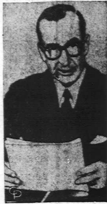
Buvęs prezidentas Pedro Aramburu davė suprasti Argentinos prezidentui Frondizi, jog būtų geriau kraštui, kad jis atsistatytų.

Rawson apkaltino prezidentą, kad išdavęs Aramburu tarpininkavimo pastangas ir vartojęs jėgą pasilikti valdžios viršūnėje. Jis ragino visus kitus kari-