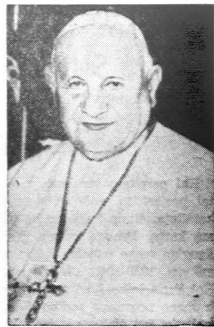
Sv. Tėvas Jonas XXIII šaukiąs visuotinį Bažnyčios susirinkimą

Kadangi per šimtmečius atsirado skirtumų ir doktrinoje, ir papročiuose, ir liturgijoje, tai susivienijimo klausimas visų krikščionių ir visame pasaulyje neišsprendžiamas kelis, nors ir broliškiausioje nuotakoje, serosiu rėmuose. Ir būsimasis susirinkimas nesikėsina šį reikalą