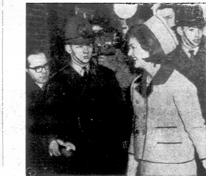
Mrs. Jacqueline Kennedy, JAV prezidento žmona, vakar iš Londono išskrido į Washingtoną.

Streikas, suparalizavęs 320 meksikiečių medvilnės jonių, trukęs dvi savaites baigtas praėjusį šeštadienį. Darbininkai, gavę atlyginimų padidinimą, grįžo darban pirmadienį.