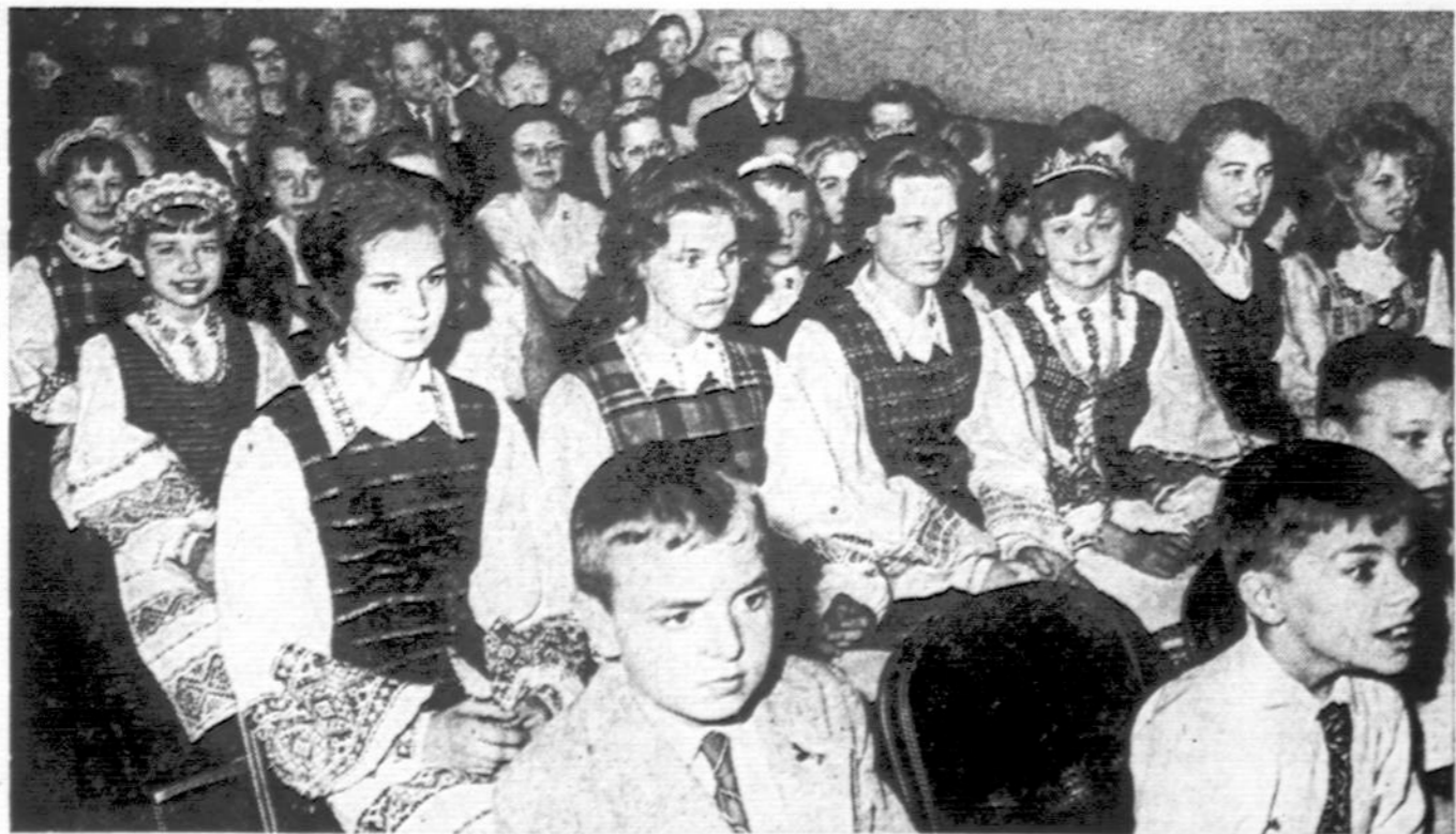
Dalis svečių ir programos išpildytojų lituanistinių mokyklų pasirodyme, praėjusį šeštadienį Jaunimo Centre, Chicagoje.

4545 West 63rd Street Chicago 29, Illinois