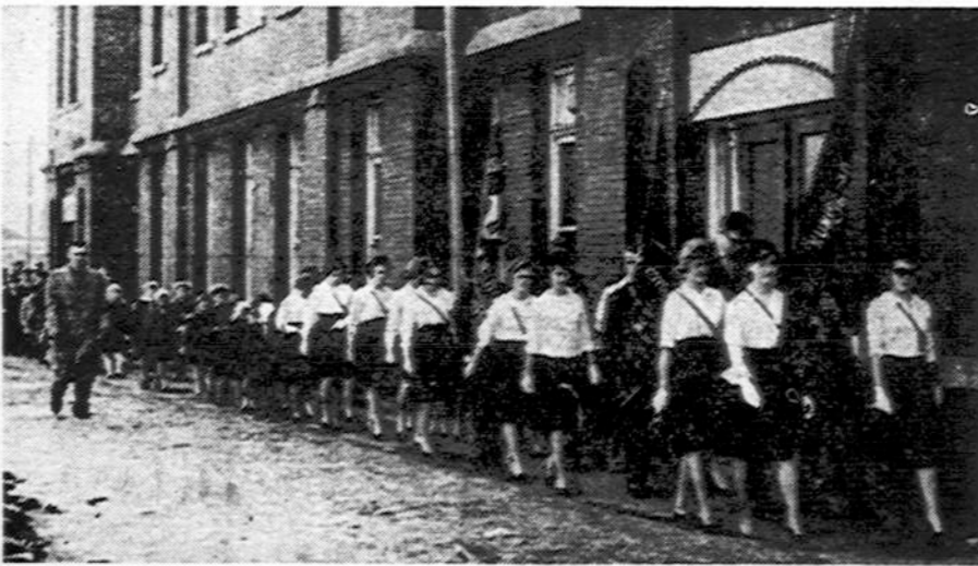
Cicero ateitininkų eiseną kuopos šventėje kovo 18 d.