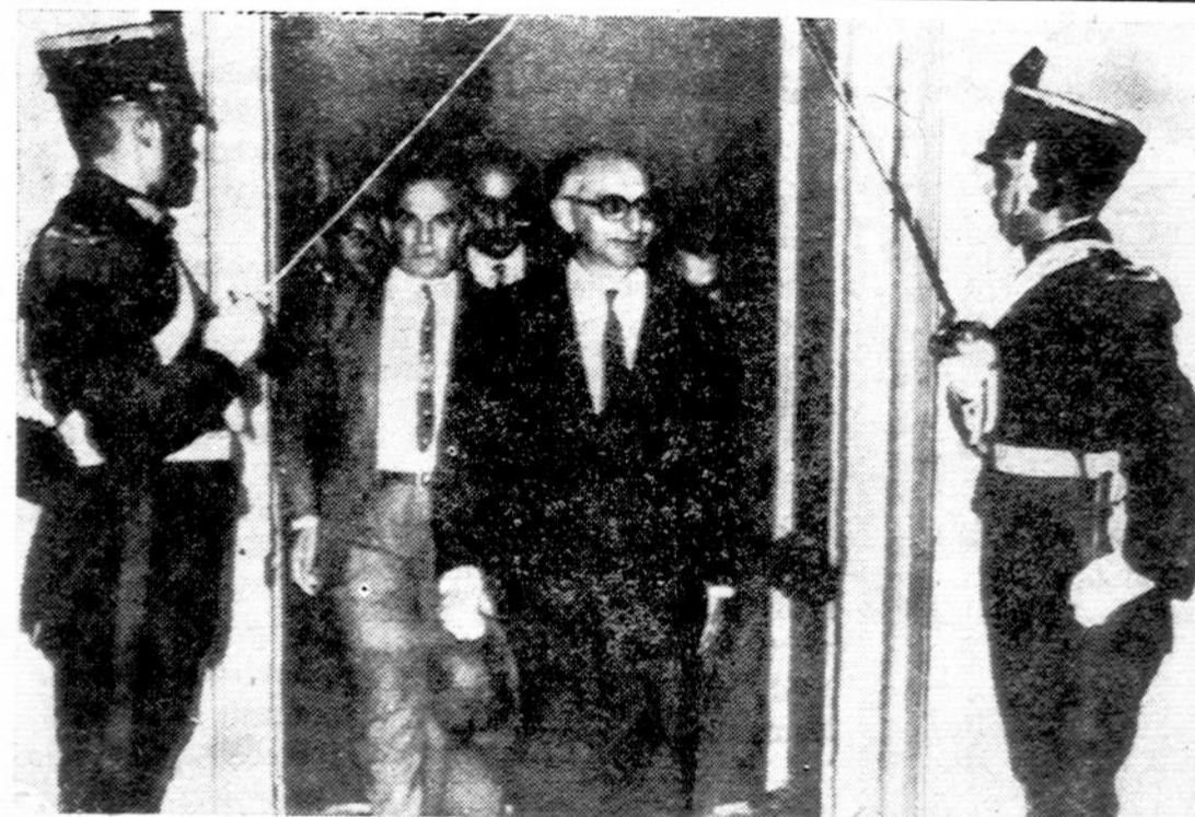
Argentinos prez. Frondizi eina iš vyriausybės rūmų pro sargybinių kardu skliautus. Manoma, kad Frondizi turės atsistatdynti. Privedęs kraštą prie politinės krizės, kai kuriuos postus laimėjus peronistams.

Iki šio meto nesurastas būdas gyventojus nuo branduolinių sprogmenų apsaugoti. Kondarė mosto, kuris duotų vilčių gresas įvykdė ilgus apklusinėjimus, privačios imonės jau paruošė juokingus sumanymus iš branduolinio antpuolio pasipelnymui, paskirtos sumos, sudarytos įstaigos, tačiau iki šio meto nepadaryta žygių, kurie teik