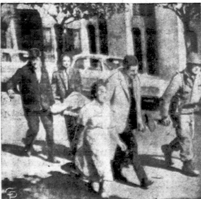
Po kautynių Alžirijoje nešami žuvusieji, kurių buvo 60. Sužeista apie 200 asmenų. Senieji kolonistai nesutinka, kad Alžirija valdytųsi pati.