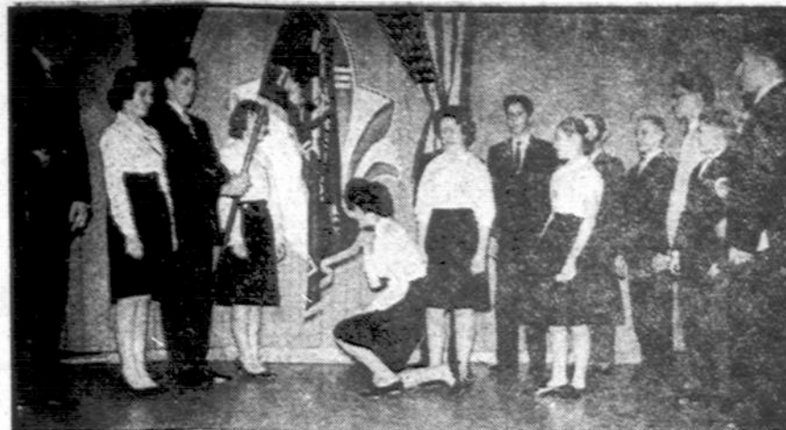
Cicero ateitininkai mokslieiviai duoda įžodį savo kuopos šventėje kovo 18 d.

Su katalikiškojo ir su jokio kito krikščioniškojo gyvenimo apraiškoms yra nesuderinamas jau visa eilė metų Kolumbijos kai kuriose vietovėse siaučiantį tai politinių grupių ar partijų, tai šiaip įvairių tamsių gaidalų organizuota teroristinė žmonių žudymo praktika. Tie šiurpulingi žiaurumai ypač yra pagausėję šiuo metu. Įvairių srovių sostinės ir provincijos Kolumbijos laikraščiai kasdien duoda žinių apie paskirose vietose politiniais ar kitais sumetimais grupėmis ar pavieniai namuose bei kelionėje užplutuotus ir į žudytuosius. Blogiausia, iš jų priegariausių valdžios pastan-