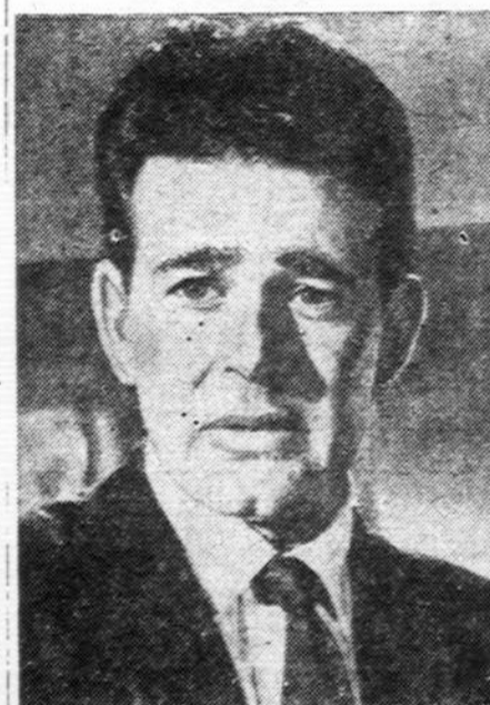
Akt. Stuart Whitman. vaidines filme "The Mark", nominuotas Oskaro premijai. Laimėtojai bus paskelbti balandžio 9 d.

Vykdomojo komiteto nariai gerbtini už daugelį darbų. Tačiau už sąmoningai padarytus nuostolius jie turėtų atsiskaityti. Atsiskaitymas, jei nebus griežtasi priemonių, eis ALT sąskaiton ir šią instituciją gali atvesti ant kiaurymės krašto. Visuomenės dalis, kuri savanoriškai sutiktų deficitą toleruoti, nesistengiant pašalinti jo priežastis, yra labai ir labai sumažėjusi.