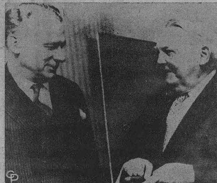
Amerikos Valstybės vicsekretorius George Ball (kairėje) kalbasi Bonnoje su Vakarų Vokietijos ekonomijos ministru Ludwig Erhard karinės gynybos reikalais ir ekonominiams klausimams. Vėliau jis Vakarų Vokietijos užsienio reikalų draugijai pareiškė, kad Jungtinių Amerikos Valstybių europiečiai sąjungininkai atsilikę kariniuose pasirošimuose ir pagalboje neturtingoms valstybėms.