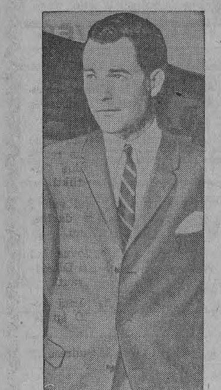
E. D. Etherington, 37 m. JAV biržos (American Stock Exchange) prezidentas.