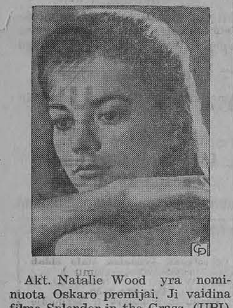
Akt. Natalie Wood yra nomi- nuota Oskaro premijai. Ji vaidina filme Splendor in the Grass.

Skaitykite ir platinkite dienraštį "Draugą"