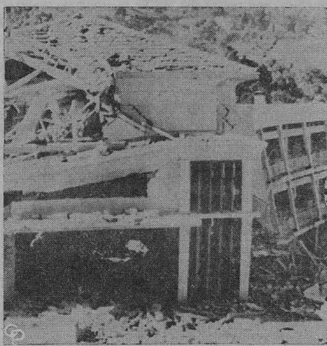
Europiečių slaptosios armijos vyrai subombardavo Fraisier ligoninę Alžiro priemiestyje Blau, Alžirijoje. Ten žuvo 10 musulmonų.

— 8,000,000 gyventojų Bulgarijoje. Raudonųjų valdomoje Bulgarijoje šią savaitę buvo 8 milijonai gyventojų.