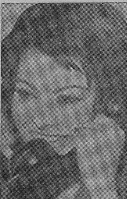
Geriausia aktorė italė Sophia Loren džiaugiasi gavusi Oskaro premiją už vaidmenį filme Two Women.

Budriko radio programos sekmad. 5 stoties WHFC, 1450 kil nuo 2 iki 2:30 valandos po pietų.