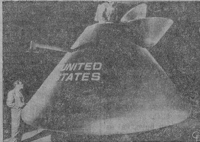
Raketos mėnulį kapsulė Apollo. Viršų matyti kaip ji atrodo iš lauko. Į ją lipa astronautas per viršų. Apačioj raketos vidus, talpinantis tris žmones. Laivas yra 13 pėdų skersmės (apačioj ir 12 pėdų aukščio). Kapsulę stato North American Aviation bendrovė.