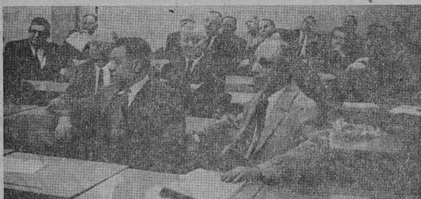
Čikagos žurnalistai, susirinkę į savo popietę, kurioje aptaria-mi laikraščiniai ir visuomeniniai reikalai.