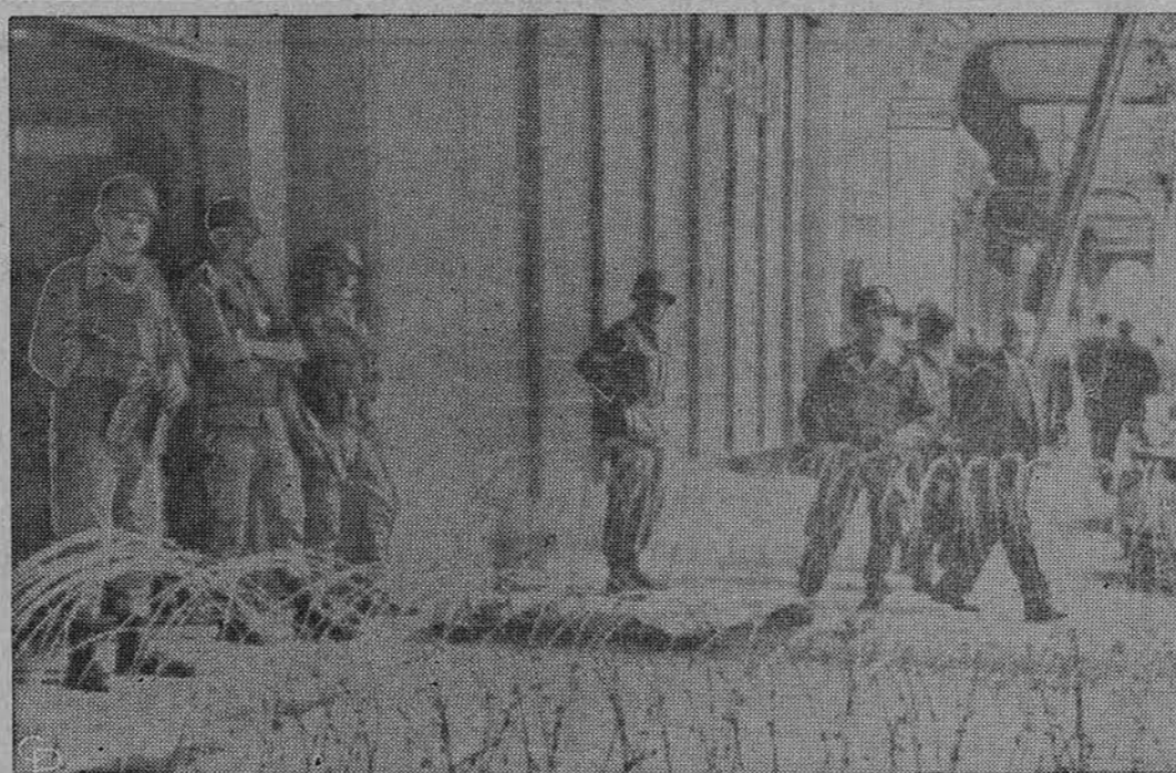
Prancūzai kareiviai saugo vieną banką Alžire, Alžirijoje, aptvertą spygliuota tvora. Uždarytosios slaptosios organizacijos vyrai išbrauna į bankus ir pasiima iš ten pinigų savo veiklai.

Vėl kitas vaizdas stotyse, tai Kalėdų, N. Metų proga ypatingai pakilęs Vokietijoje dirbančių italų, ispanų, graikų judėjimas. (Nukelta 4 psl.)