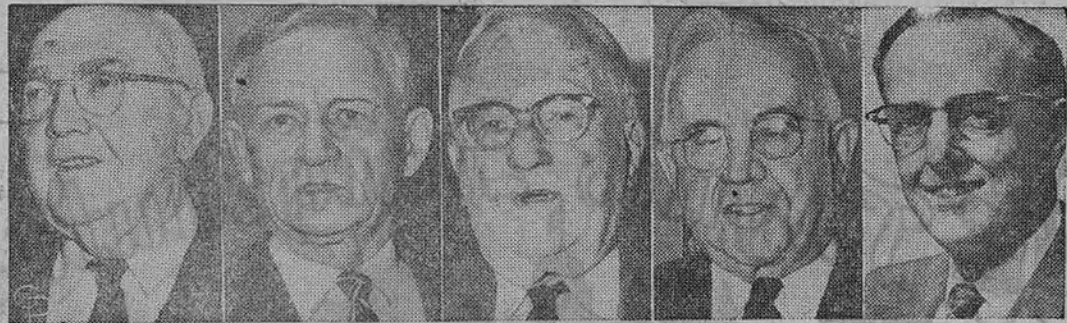
Brent Spence, 89, D-Ky. Clare Hoffman, 87, R-Mich. John Taber, 82, R-N.Y. Noah Mason, 80, R-Ill. Walter Judd, 63, R-Minn.

Iš JAV kongreso pasitraukia šios sesijos gale apie 30 kongreso narių, penkiolika demokratų ir penkiolika respublikonų. Vieni jų dėl senatvės, o kiti bando laimę patekti į senatą. Čia matyti penketas pasitraukiančiųjų.