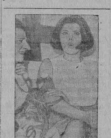
Oskaro laimėtoja akt. Sophia Loren Romoje jaučiasi nepėriogiamai, atkodama Italijos Raudonajam Kryžiui kraują.

Kubos pabėgėliai ir amerikinis paštas daro plyšius JAV embargui, tai užuolaidai, kurią JAV užleido prieš Kubą. Žinoma, tie plyšiai nėra dideli — ne didesni, kaip tie daiktai, kurie gali būti įdedami į voką ir pasiunčiami į Kubą. Pasirodo, kad apie 100,000 kubiečių emigrantų siunčia laiškuose skutimosi peiliukus, nailonines kojines, tinkliukus plaukams; visa tai eina pirmos klasės laišku vokuose, kurie neatidaromi. Visų tų dalykų trūksta Kuboje. Labiausiai pageidaujami amerikiniai skutimosi peiliukai, nes čekoslovakiniai, kurie dabar Kuboje parduodami, yra neaštrūs ir blogai skuta. Lietuvoje, tur būt, irgi čekoslovakiai peiliukai tegausiami pirkti ir todėl amerikiniai labai pageidaujami.