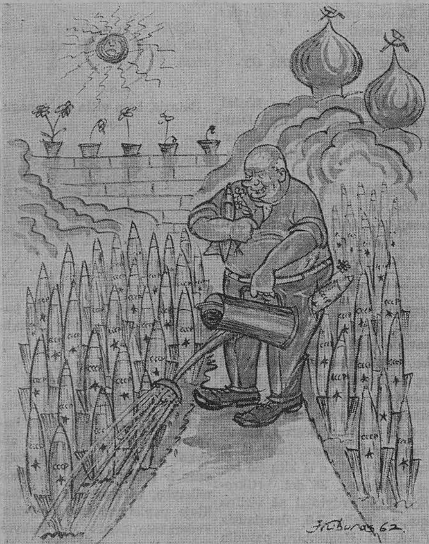
Kremliaus gėlynas, pavasariui atėjus