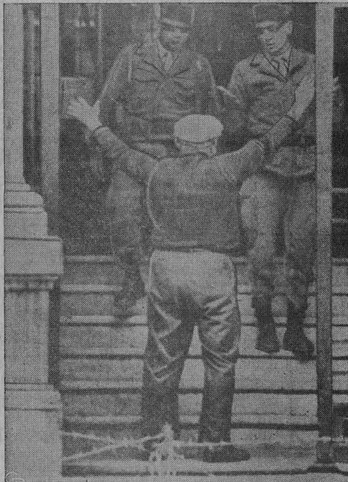
Žmogus sulaikomas prie banko Alžire. Alžirijos sostinėje, patikrinant, ar jis turi ginklą. Kiekvienas asmuo, einantis į banką, patikrinamas prancūzų karių, kadangi slaptosios armijos organizacijos (OAS) nariai gana dažnai apiplėšia bankus. Pagrobtį pinigai panaudojami OAS veiklai prieš prancūzų prezidento de Gaulle politiką.

— Švedija atsilikusiems kraštams pakels pagalbą maždaug $10,400,000 iki $26,000,000 sekančiais fiskalniais metais.