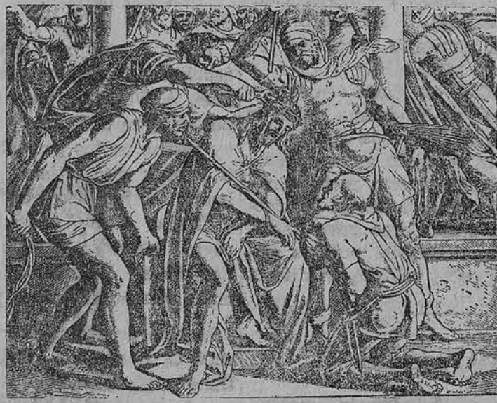
Didysis trečiadienis. Kareiviai, nupynę iš erškėčių vainiką, uždėjo jam ant galvos, apsiutė Jį purpuriniu drabužiu, ėjo prie Jo ir sakė: Sveikas, žydų karaliau. Jono 19, 2-3.

Ji dėsciusi vaikams fortepijono pamokas „Avtopribor“ muzikos mokykloje. „Dar dabar prisimindami metus praleistus užsienio politikai surasti atsparą Lenkijoje ir Vokietijoje. Kai jis apledo užsienio reikalų ministeriją, Lenkija jau buvo žlugusi, o reichas jau Sovietams pridedavo Latviją, lyg jo nuosa