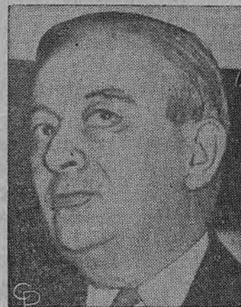
Georges Bidault, buvęs Prancūzijos premjeras ir buvęs prezidento Charles de Gaulle užsienio reikalų ministeris, yra Šveicarijoje, kur jis telkias opoziciją prieš prancūzų prezidento politiką Alžirijoje. Atrodo, jog jis esąs susirūpęs su slaptosios armijos organizacija (OAS) Alžirijoje.

Pentagonas taipgi liepė nutraukti rodymą filmo "Operation Abolition", kur buvo nu-