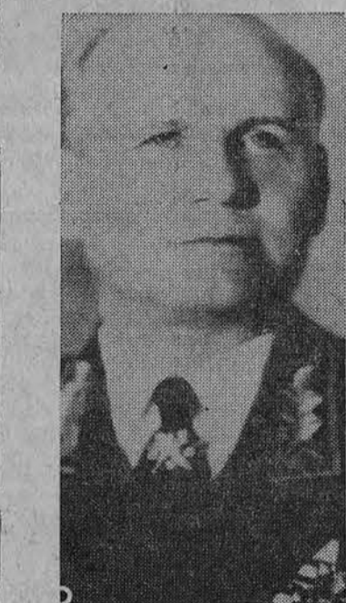
Sovietų maršalas I. Koniovas, 64 m., pravardžiuojamas "tanku" dėl savo kietumo, atsauktas iš Rytų Vokietijos į Maskvą.