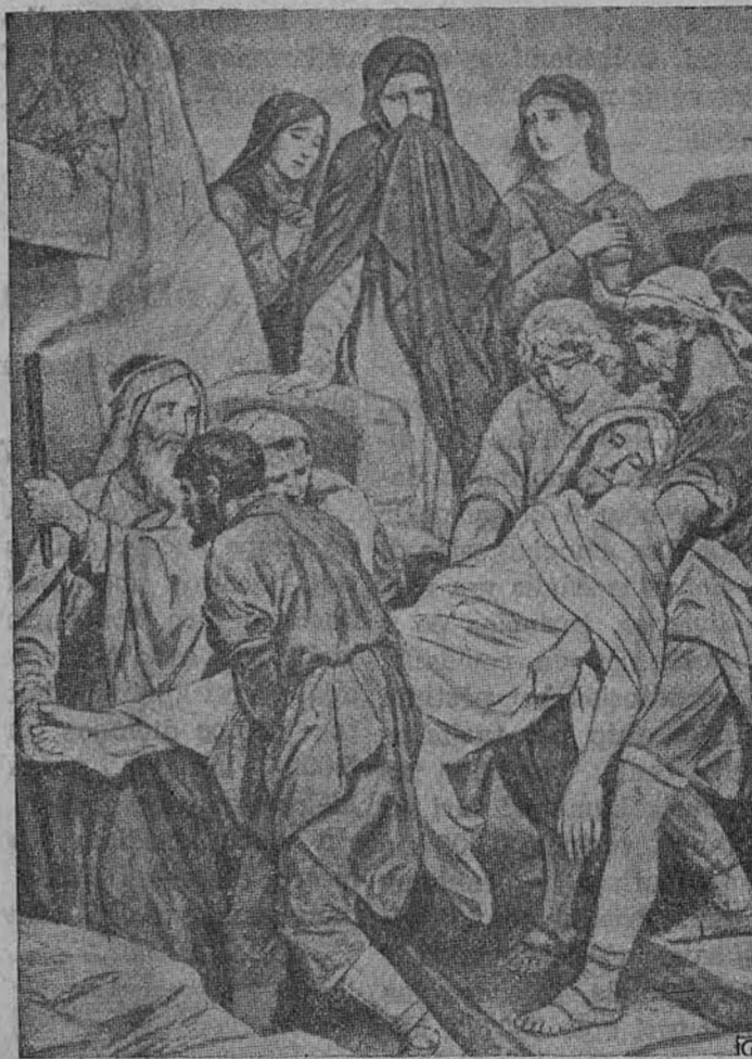
Didysis šeštadienis. Po to Juozapas iš Arimatėjos (būdamas Jėzus mokytojas, tik slaptas iš baimės žydu) prašė Pilotą leisti jam nuimti Jėzus kūną. Pilotas leido. Taigi, jis atėjo ir nuėmė Jėzus kūną. Jono 19,38.