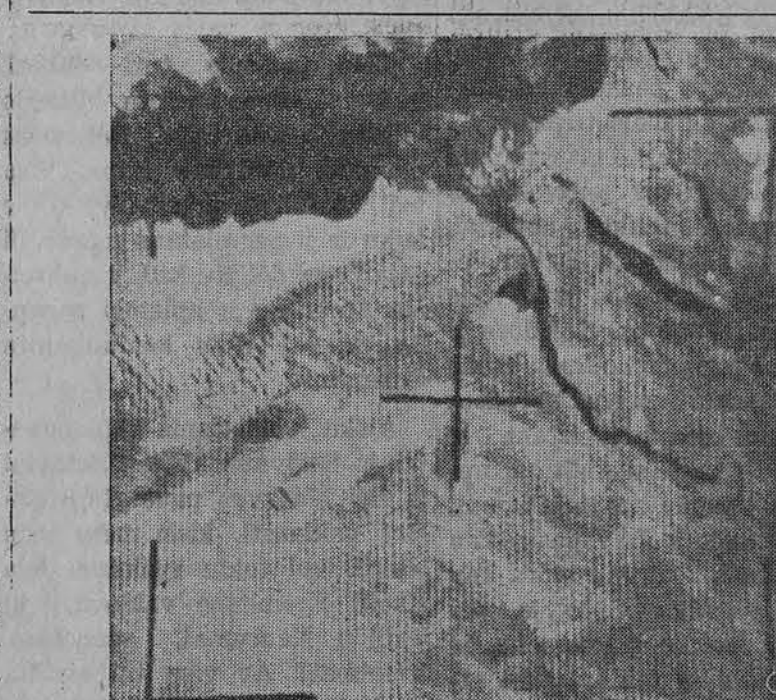
Taip atrodo Sv. Žemė iš JAV satelito Tiroso IX, kuris skrieja apie žemę. Nuotraukoj matyti Egiptas, Izraelis, Raudonoji Jūra, Nilo upė, Mirties Jūra ir kt.

Ar ši pirmoji tokia sovietinėje praktikoje administracijos ir partijos sintezė įveiks kolchozinės baudžiavos ūkinį atsilikimą, kuris pirmojo eilę yra ne administracinio, bet struktūrinio pobūdžio, pačios nelemtos kolcho-