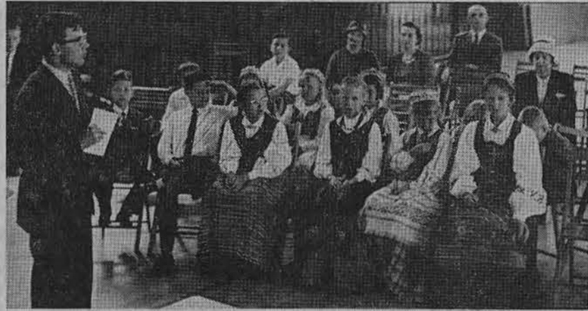
Balandžio 15 d. Los Angeles parapijos salėje jaunieji ateitininkai davė priesaiką tik ką pašventintai savo vėliavai. Nuotraukoje: būrelis davusių priesaiką.

Los Angeles lietuvių kultūros klubas, gegužės 19 d. rengia svarstymų vakarą (panel), skiriant mūsų spaudos problemas