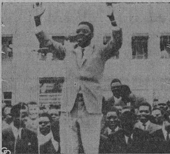
Kongo sostinės, iš kur kongiečių pareigūnai nenorėjo jo išleisti. Jungtinių Tautų kariniams pareigūnams įsikūsus, Tshombe saugiai Katangos prezidentas Tshombe grįžo namo iš Leopoldvilės, centro grįžo į Elizabethville.

— Dievas nori, kad visi žmo nės pasidarytų amžinai laimingi, tačiau ne tuo keliu, kad jiems laisva valia būtų atima ma. — Sv. Augustinas