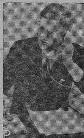
Prezidentas Kennedy, paspausdamas auksinį telegrafo mygtuką, atidarė pasaulinę parodą Seattle mieste, Wash. Prezidentas kalba telefonu iš Palm Beach, Fla., su Seattle parodos pareigūnais.