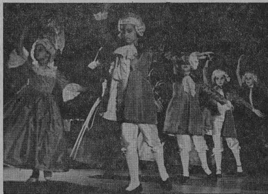
Soka Velbasio baleto studijos mokiniai