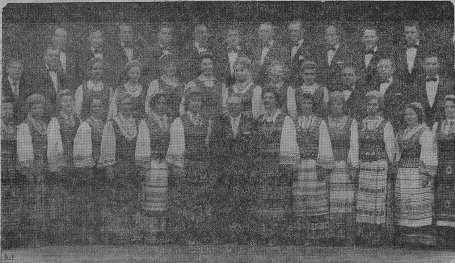
Rochesterio lietuvių choras