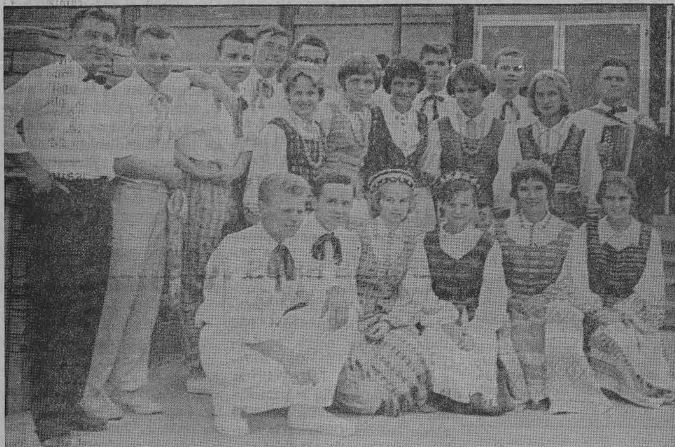
Rochesterio tautinių šokių grupė

Dr. Karl Barth, 75 metų šveicaras, neortodoksų protestantų teologijos vyriausias kūrėjas, pirmą kartą susitikęs su dos atstovus Amerikoje, Chicago universiteto Swift salėje, balsiai pasipriešino prieš uždeg tas televizijos programai reikalingas šviesas, sakdamas, kad tai yra "sėtono darbas."