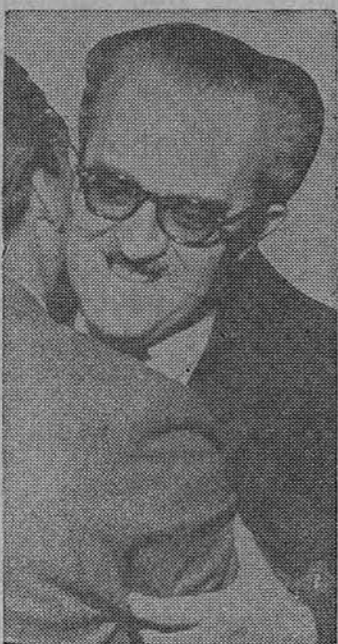
Guillermo Leon Valencia, naujas Kolumbijos prezidentas

— Frondizi, nuverstas Argentinos prezidentas, parašė laišką buvusiam diktatoriui Peronui, siūlydamas bendradarbiauti. Peronas dabar yra Ispanijoje, o Frondizi vienoje Argentinos saloje karių priežiūroje, bet jis būsiąs išleistas į užsienį.