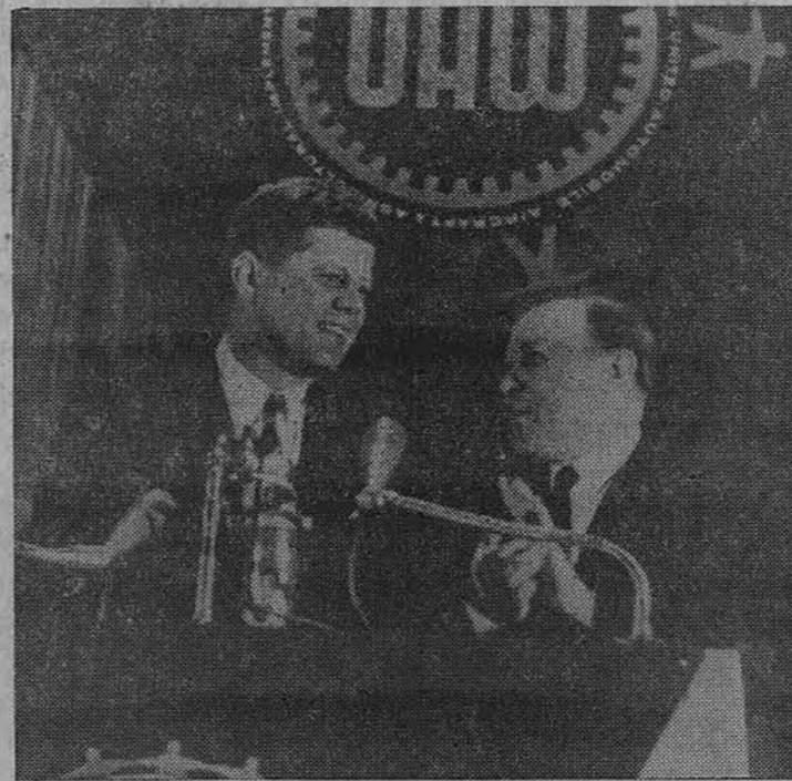
Prezidentas Kennedy pasakė kalbą United Auto Workers unijos suvažiavime Atlantic City, pareiškdamas: "Aš noriu apsaugoti Jungtinių Amerikos Valstybių ekonomiką, palaikydamas tas pias kainas. Pramonė ir darbininkai turi pagelbėti." Kairėje yra automobilių darbininkų unijos pirmininkas Walter Reuther.

Kongo parlamentas išleido įstatymą pagal kurį dabar Kongo vyriausybė gali traukti į teisimą Gizengą už riaušių kėlimą. Gizengą yra kongiečių vadas, žiūrijs į Maskvą.