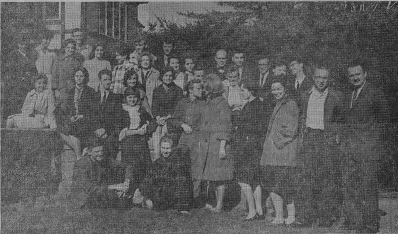
Studentų Ateitininkų sąjungos ideologinių kursų, buvusių balandžio 19-22 d. Kennebunkport, Maine, lektoriai ir dalyviai.