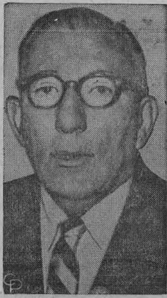
Buv. senatorius Pepper iš Floridos kandidavo į kongresą. Kaip senatorius jis pralaimėjo postą prieš 12 m. įvykusiuose rinkimuose.

— Lietuvos vyčių 79-tos kuopos jauniajai ruošia čiužinėjimo (roller-skating) vakarą tik lietuviams ateinančią pirmadienį, gegužės 14 d., nuo 6:30 iki 9:30