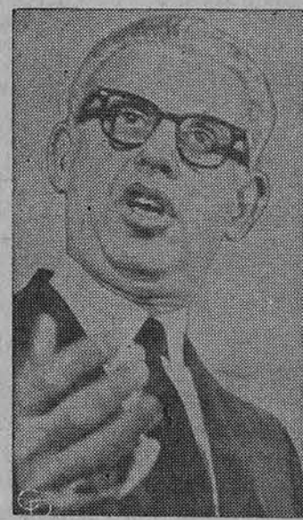
JAV Darbo sekretorius Arthur Goldberg pranešė Washington, kad balandžio mėnesį sumažėjo 430,000 bedarbių.