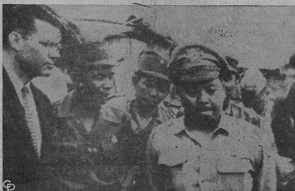
JAV gynybos sekretorius Robert S. McNamara (kairėje), atvykęs į Pietų Vietnamą, klausinėja ūkininkų (dešinėje) komunistų grasinamoje Ben Tuong apylinkėje. Jį lydi gen. Nguyen Khanh (viduryje).

Buvęs prezidentas Eisenhoweris susirūpinęs, kad prezidentas Kennedy pastangos padidinti federalinės vyriausybės galias sudaro pavojų amerikiečių laisvėms. Jis taip pat kritikavo administracijos politiką plieno kainų epizode.