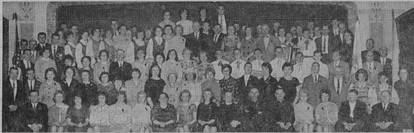
Naujosios Anglijos apskr. Lietuvos vyčių pavasarinis seimas Worcester, Mass.