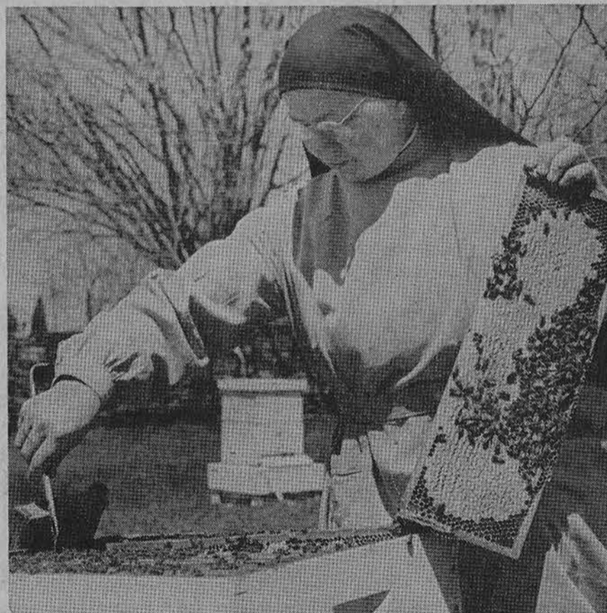
Darbai bityne, Putnam, Conn.

Marija antrame pasirodyme ragino žmones mesti nuodėmės gyvenimą: „Žmonės turi taisyti savo gyvenimą ir atsiprašyti Dievą už įžeidimus. Žmonės turi liautis įžeidinėti Dievą, kuris jau per daug yra įžeistas.“ Šie Marijos žodžiai paliko vaikams (Nukelta 1 4 psl.)