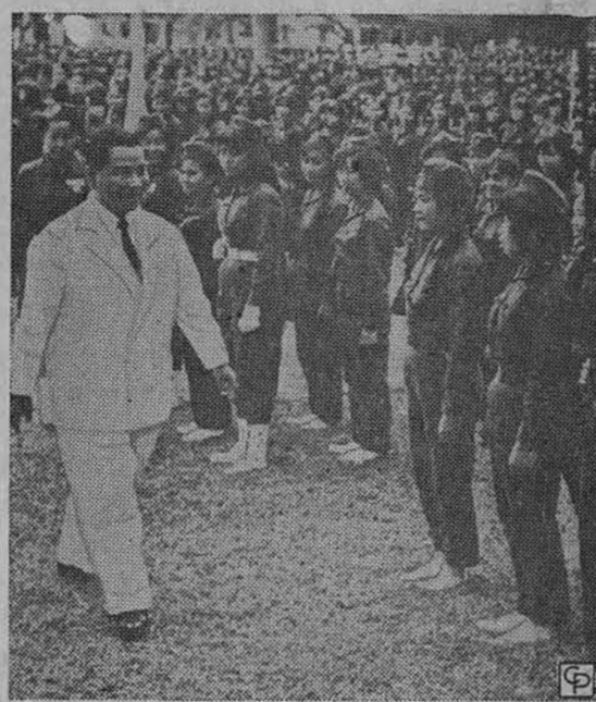
Pietų Vietnamo prezidentas Ngo Dinh Diem patikrina moterų karinius dalinius atlikus pratimus (manevrus).

Seimas tęsis maždaug iki 5 val. Vakare bus bendra vakarieni Bowling Lounge restorane, 56 gatvė ir Western. Seimas bus baigtas tą pačią dieną.