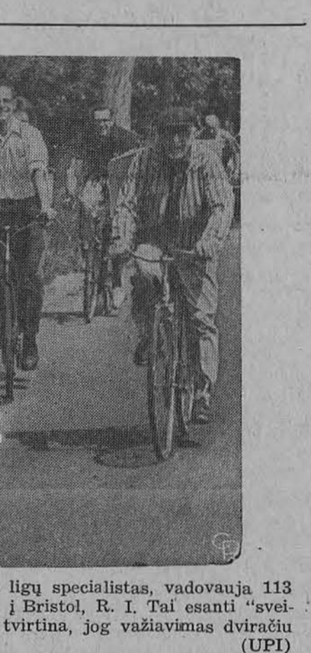
Dr. P. D. White, Bostono širdies ligų specialistas, vadovauja 113 dviratinku iš Barrington, R. I., Bristol, R. I. Tai esanti „sveikatos kelionė“, kadangi daktaras tvirtina, jog važiavimas dviračiu teigiama veikia širdį.