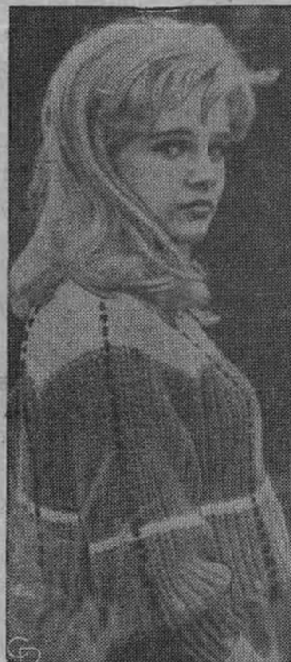
Sue Lyon vaidina Nabukovo filmo Lolitha. Kadangi aktorė tėra tik 15 m., o filmas skirtas tik suaugusiems, tai klausimas kaip mergaitė galės pamatyti savo filmą.

— Sovietų Sąjungos ekonomistai ir komunistinio bloko vadai sekantį trečiadienį Maskvoje pradės svarstyti ekonominius reikalus. Žinoma, posėdžiuose bus paliesta Europos Bendroji Rinka.