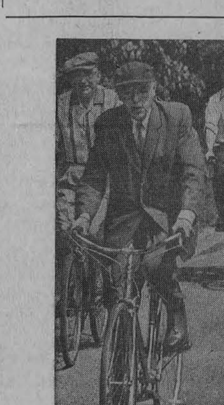
Dr. P. D. White, Bostono širdies ligų specialistas, vadovauja 113 dviratinku iš Barrington, R. I., Bristol, R. I. Tai esanti „sveikatos kelionė“, kadangi daktaras tvirtina, jog važiavimas dviračiu teigiama veikia širdį.