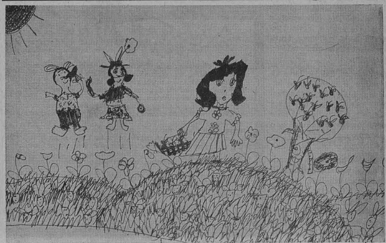
Zuikūčiai džiaugiasi išvydę uogaujančią mergaitę.