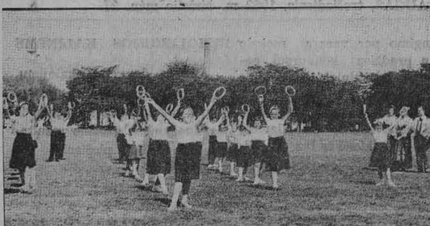
Vaikų festivalyje birželio 17 d. Marquette Parke, mokiniai išpildė "Lietuva brangi".