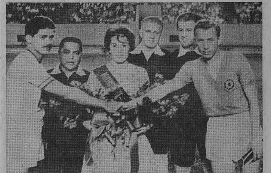
Prieš rungtynes, Meksikos Guadalajara futbolo komandos kapitonas spaudžia ranką Jugoslavijos Hajduk-Split komandos kapitonui. Stebi Midwest Soccer Promotion Association grožio karalaitė ir rungtynių teisėja. Rungtynes laimėjo Hajduk 2-1.