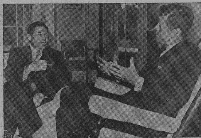
Filipinų viceprezidentas Emmanuel Pelaez (kairėje) pareiškė prezidentui Kennedžiui, kad Filipinai yra "ištikimiausias" JAV sąjungininkas pietryčių Azijoje

Visoje Italijoje ir užsienyje plačiai skaitomas religinės kultūros laikraštis "La Rocca" pasakutiniame numeryje net tris didelius puslapius paskyrė Sibiro lietuvių maldaknygei. Straipsnis iliustruotas maldų pavyzdžiais ir nuotraukomis iš