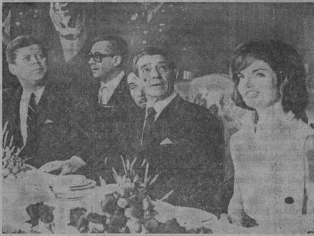
Prezidentas John F. Kennedy, su žmona Jacqueline pietuose su Meksikos prezidentu Lopez Mateos, laike savo vizito Meksikoje.

Vakarų Berlynui iš Vakarų Vokietijos gabenamas maistas, lygiai kaip ir kiti gaminiai, sovietinės santvarkos Rytų Vokietijoje vykdytojų apkraunami nemažais mokesčiais. Pavyzdžiui, už naudojimąsi Rytų Vokietijos autostrada sunkvežimiu tik už vieną kelionę Vakarų Berlynan tenka sumokėti mokesčių nuo 100 ligi 150 DM. Tie mokesčiai gerokai pabrangintų maisto produktus ir kitus gaminius Vakarų Berlyne, jei tų mokesčių nepadengtų Vakarų Vokietijos vyriausybė Bonijoje.