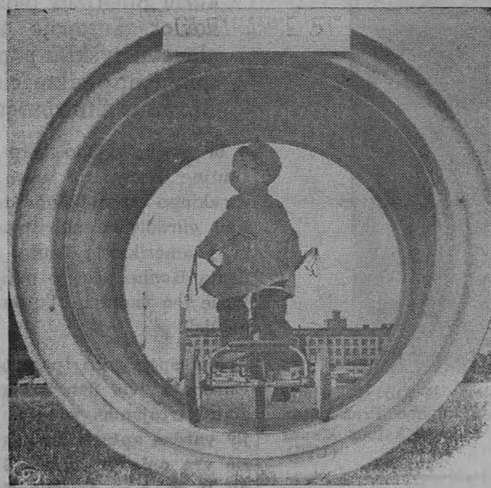
Didžiausia pasaulyje padanga — 10 pėdų, skirta žemės kasimo mašinoms. Čia nufotografuome tos padangos rėmą išsitenka 4 m. berniukas su dviratū. Padangą gamina Goodyear, Akron, Ohio.