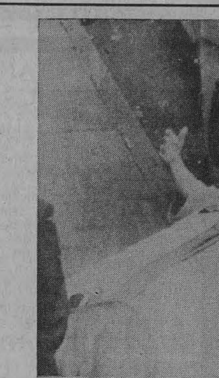
Winston Churchillis, grįžęs iš Rivieros į Londoną, nuo neštuvų rankos mostu sveikina atvykusius jį pasitikti. Churchillis dabar turi 87 m. amžiaus; lūžus klubui, dabar gydomas Londono Mid- lesex ligoninėje.