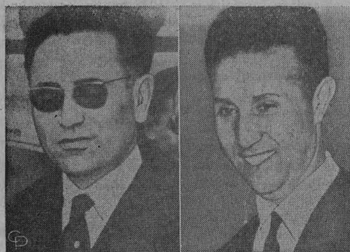
Ben Youssef Ben Khedda

Alžirijos tautiniai vadai stengiasi kaip galima sumažinti visus skirtumus tarp vadovaujančių asmenų — pirm. Khedda ir vicepirm. Bella. Rocher Noir