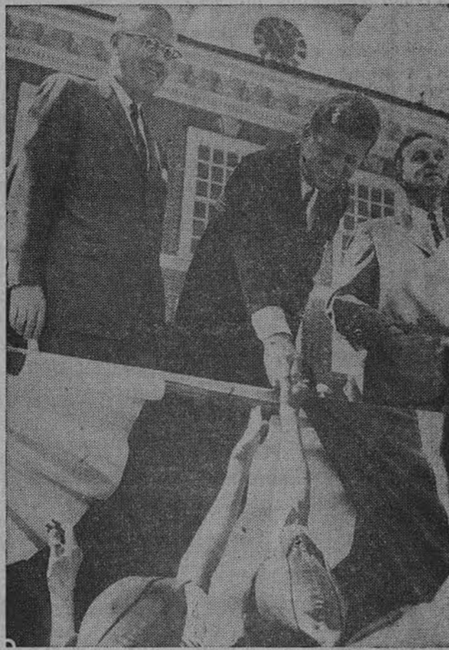
Prez. Kennedy lenkiasi žemyn nuo platformos iš kurios kalbėjo Philadelphiaje liepos 4 d. gubernatorių suvažiavime. Prezidentas pabrėžė, kad sieks vienybės su Europa. Prezidento kalbos klausė be 50 gubernatorių apie 100,000 žmonių.

CHICAGA. Vienos dienos šventės metu (skaičiuojama 30 valandų) žuvo 155 asmenys. Tai naujas rekordas vienos dienos šventės metu. 1937 m. liepos 4 d. žuvo 137 asmenys. Chicagoj žuvo tik vienas asmuo. Daugiausia, kaip ir dažnai, žuvo Californijoje — 21 asmuo, antroj vietoj New Yorke — 12.