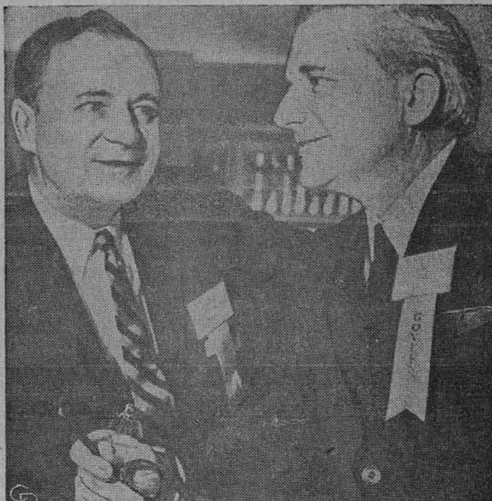
Du broliai gubernatoriai susitiko gubernatorių suvažiavime Hershey, Pa. Tai Price Daniel, Texas, ir Bill Daniel, Guam.

Jersey City garazo darbininkai rado mašiną 2.4 mil. dol. Tiriama kieno tie pinigai.