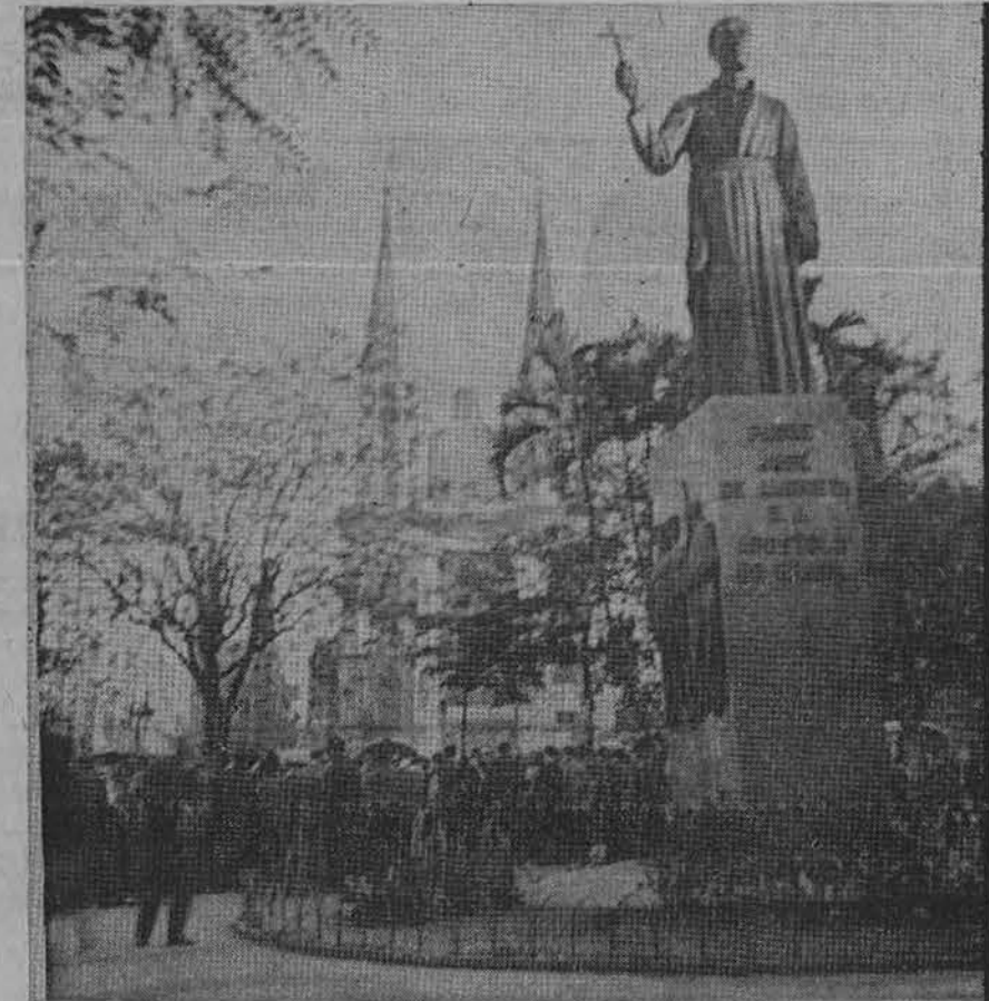
Minios žmonių Prace da Se aikštėje Sao Paule, tuoj po Brazilijos su Čekoslovakija futbolo žaidimu.

Visose krašto dalyse, visuose braziliško gyvenimo sektoriuose susidarė slegianti situacija.