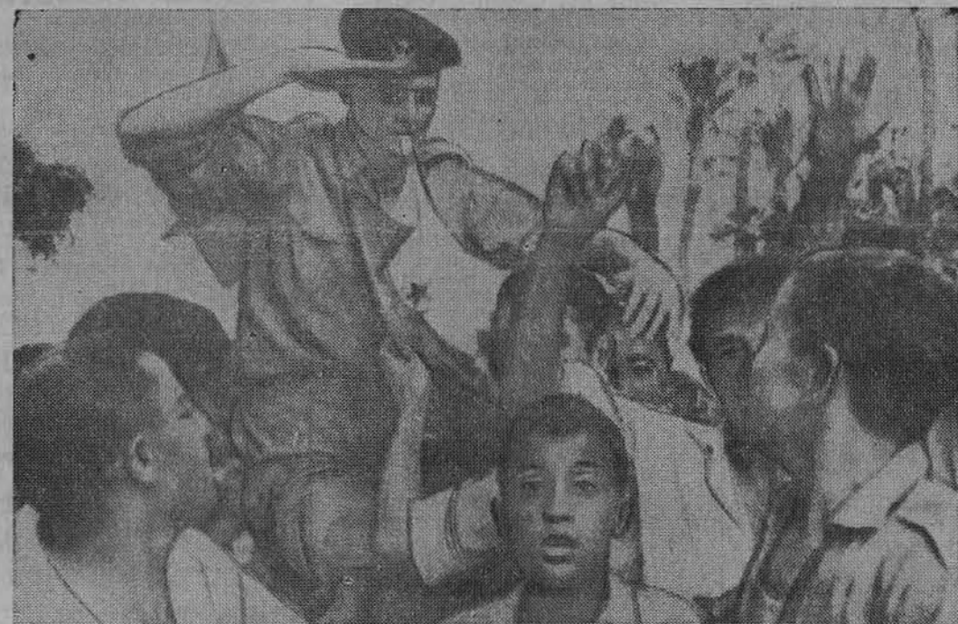
Džiaugdamiesi musulmonai neša Prancūzijos karėivį, apsuptą vėliava, ant kurios įrašyta F L N (Tautinis Išlaivinimo Frontas).