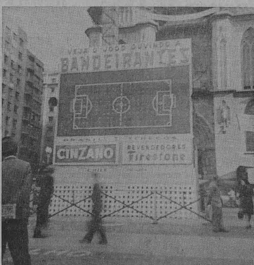
Rinkiminė lenta, kurioje buvo duodami futbolo žaidimų rezultatai Brazilijoje. Per 20,000 žiūrovų stebėjo tą lentą.

× Eilė lietuvių ligonių ir naujai iš Lietuvos atvykusių šeimų Vokietijoje labai nori gauti lietuvišką laikraštį — dienraštį, bet neįstengia užsiprenumeruoti. Laukiama geradarių talkos, už ką tie ligonys ir tremtiniai būtų kasdien dėkingi, per dienraštį palaikydami ryšį su lietuviška visuomene visuose pasaulio kontinentuose. Sutinkantieji šį reikalą savo auka paremti, prašomi kreiptis į "Draugo" administraciją, kuri patarpininkaus.