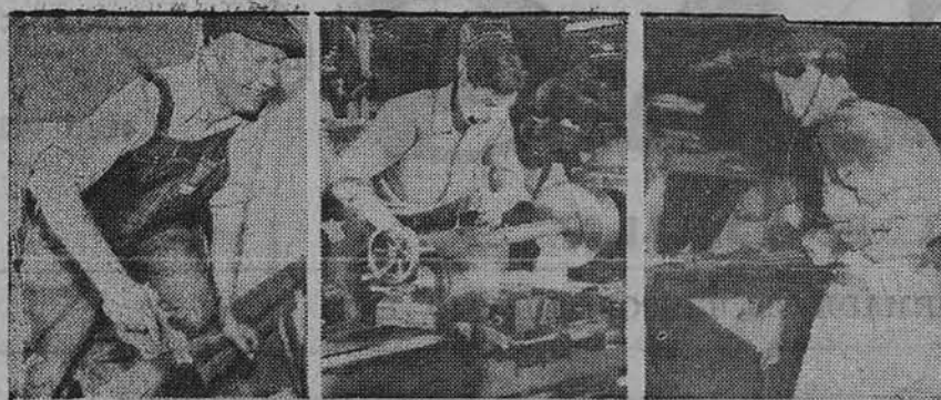
Carpenters $20,114,000 Machinists $18,723,000 Mine Workers $18,575,000