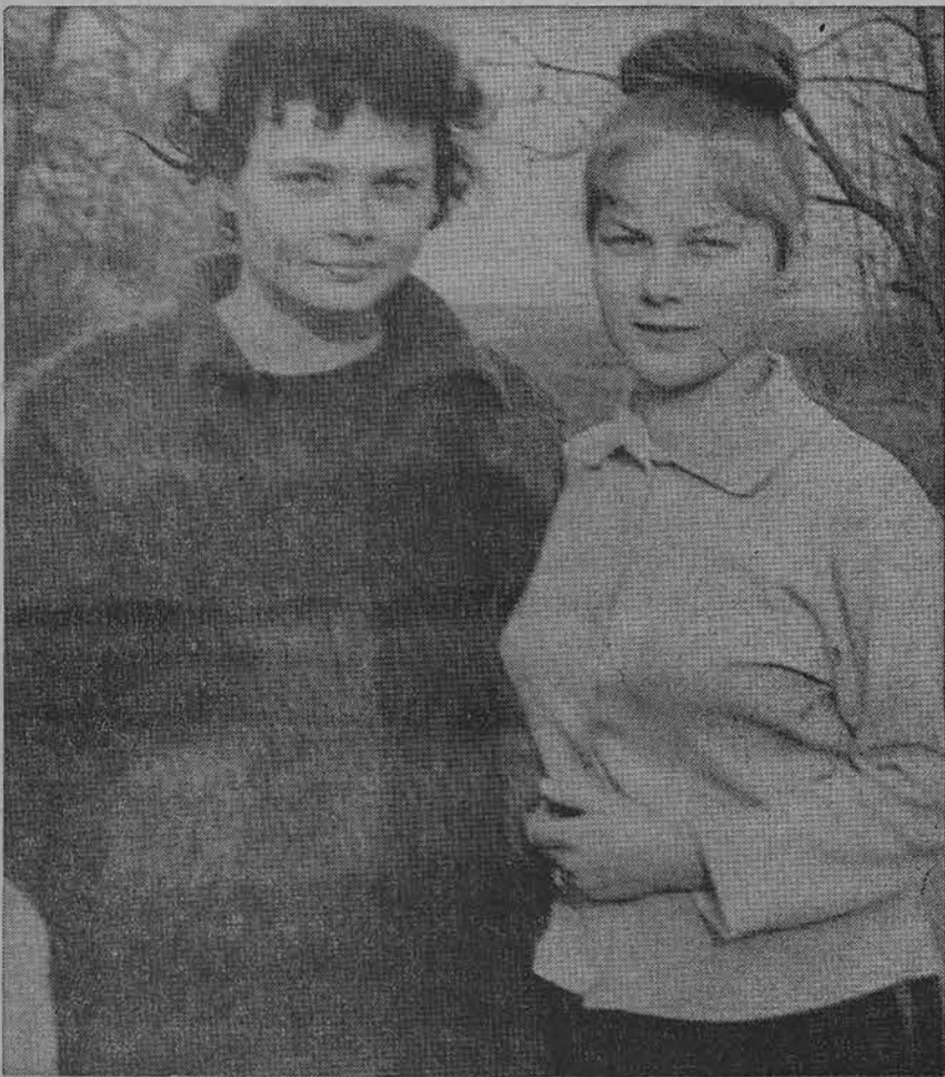
Dvi lietuviškos iš Vasario 16 gimnazijos