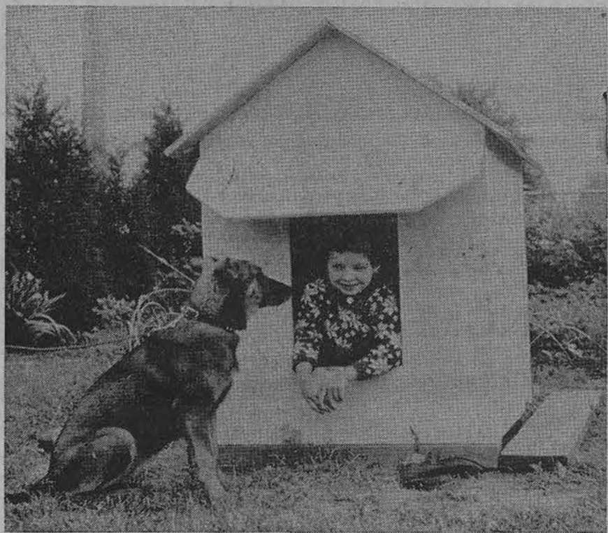
Vida ir Pūkyk varžosi dėl pavėsio vasaros karščiuose