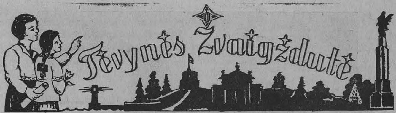
Redaguoja Lietuvių Mokytojų S-gos Chicagoos sk. redakcinis kolektyvas Red. J. Plačas, red. pavad. M. Steikūniene. Medžiaga siūsti: 7045 So. Claremont Ave., Chicago, Illinois