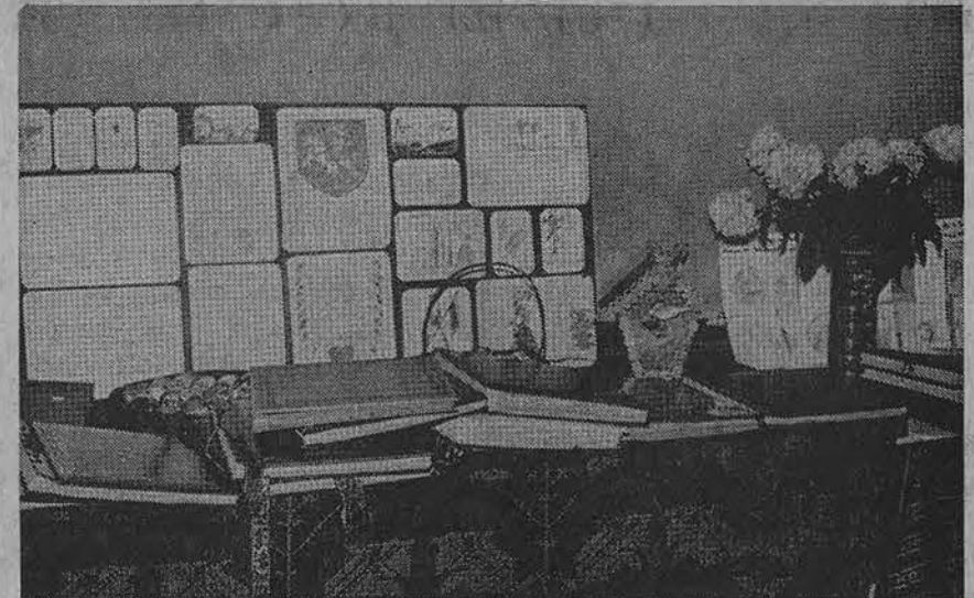
K. Donelaičio lit. moklos mokslo metų užbaigimo parodėlės dalis.

Paulius buvo blogiausias mokinys klasėje. Pamokų metu galvą ranka parėmęs užmigda-