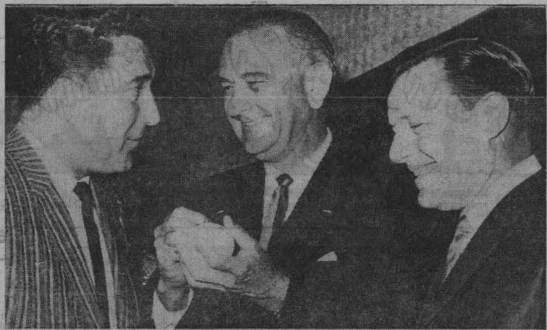
Viceprezidentas Lyndon B. Johnson dalyvavo pietuose Washingtono, kur susitiko su Freddie Hutchinson (kairėje) — National League geriausių žaidėjų rinktinės vadovu — ir su Ralph Houk, kuris yra vadovas American League geriausių žaidėjų rinktinės. Tos dvi geriausios komandos susitiko naujame Columbijos distrikto stadione. Rungtines laimėjo National lyga 3-1.