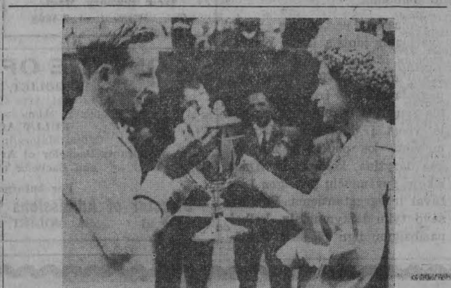
D. Britanijos karalienė Elzbeta II įteikia laimikį Australijos teniso čempionui Rod Laver, 23 m.

Šis A. t. pasisakymo motyvų klausimu matome, kad A. t. remiasi čia pirmuoju konstitucijos pakeitimu, kuris numato baznycios nuo valstybės atskyrimą: „Congress shall make no law respecting an establishment of religion, or prohibiting the free exercise thereof...“ jeigu pagal tą pakeitimą yra priešingas konstitucijai liečias tikybės reikalus įstatymas, tai, akademiškai galvojant, turi būti priešingas ir liečias tuos reikalus administracijos potvarkis. Bet kai sakytas administracijos potvarkis mažai kuo skiriasi nuo daugelio kitų, kurie liečia Dievo minėjimą viešo pobūdžio atvejais (invokacijose, įrašuose valdžios įstaigų sienose, metaliniuose piniguose ir daug kur kitur), tai ateistai dabar gali reikalauti, kad Dievas būtų išvytas ir iš ten. Relingame krašte tai negali nesukelti susirūpinimo. Tas susirūpinimas jau pasireiškė reikalavimuose, kad šio krašto konstitucija būtų tinkamai pakeista. Tuo tarpu visą tą „erzelį“ yra sukėlusio savo kreipimusi į A. t. nedidelė ateistinė organizacija. Dėlto savaine ky-la klausimas, ar nebūtu buve geriau, jeigu A. t. nebūtu skubinesis į tą kreipimąsi atsiliepti? Juk jis tur būt, turi nemažai kitų neatliktų darbų.