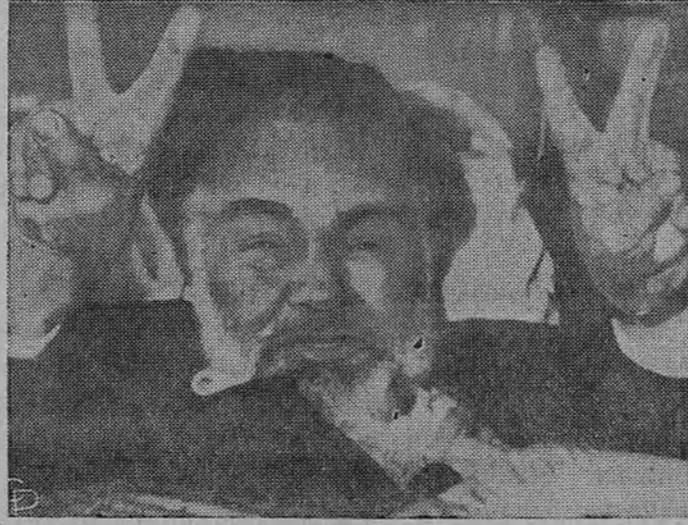
Aktorius Edward G. Robinson, sprausminiu lėktuvu atskraidintas gydytis į Londoną pirštais rodo Churchillio pergales ženklus. Robinsonas gavo širdies ataką Tanganikoje besukant filmą "Samy Going South".

Tam tikras ribas sudarė parodos taisyklės, neleidžiančios grynai politinės propagandos. Tačiau politinė propaganda yra labai plati sąvoka. Nesant jokio reikalo šia prasme eiti į kraštutinumus ir operuoti šūkiiais, tiek Lietuvos paviljono apipavidalinime, tiek paviljono leidinyje yra operuojama faktais, kurie patys savaime jau reiškia politinę propagandą. Šia