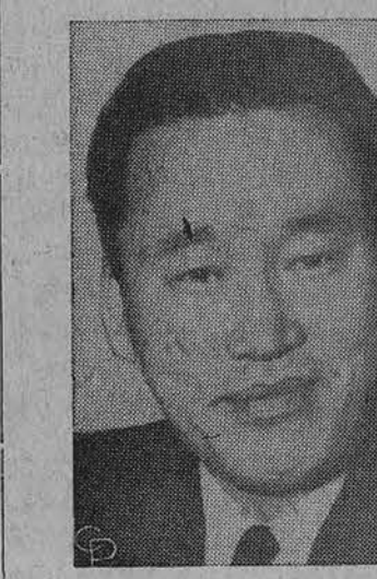
Naujas Pietų Korėjos premjeras Kim Hyun Chul, anksčiau buvęs finansų ministru Syngman Rhee kabinete.

RANGOON, Burma. — Burmos armijos grupė ir policija turėjo nuraminti riaušes tarp studentų ir policijos, kuriose žuvo 16 asmenų ir apie 60 sužeista. Riaušės kilo, kai studentai pradėjo protestuoti dėl jų keturių vadų suėmimo, kurie nesizingė Burmos revoliucinei tarybai. Tos tarybos pirm. gen. Ne Win skelbia, kad studentai yra nusikaltę tvarkai ir jau eilė metų jų didelė dalis pasižymi chuliganizmu. Studentai riaušių metu degino automobilius, mėtė akmenis į valdiškus pastatus ir policiją. Generolas sakosi apgailestaujtas, kad reikėjo riaušėm nuraminti šaukti kariuomenę, tačiau tai būtų būtina.