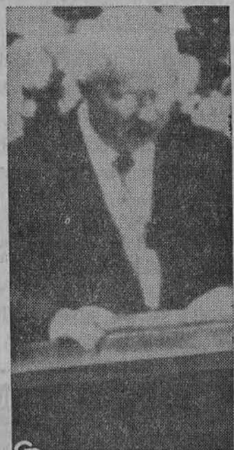
Chruščiovas, kalbėdamas vadina mame taikos kongrese Maskvoje siūlo, kad į Vakarų Berlyną, vieton sąjungininkų dalinių, būtų pasiūsti Nato ir Varšuvos pakto daliniai, bet tik į Vakarų Berlyną, ne į Rytų...