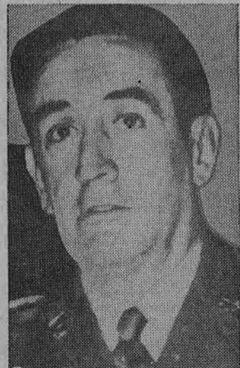
Gen. Augustin Munoz Grandes, 66 m., generalissimo Franco parinktas pavaduotoju, kuris gen. Frankui pasitraukus iš politikos, užimtų jo vietą.

NEW YORK. — Pierre Salinger, prez. Kennedy spaudos sekretorius, išskrido į Braziliją paruošti prez. Kennedy vizitą. Prezidentas ten nuvyks liepos 30 d. ir viešės tris dienas.