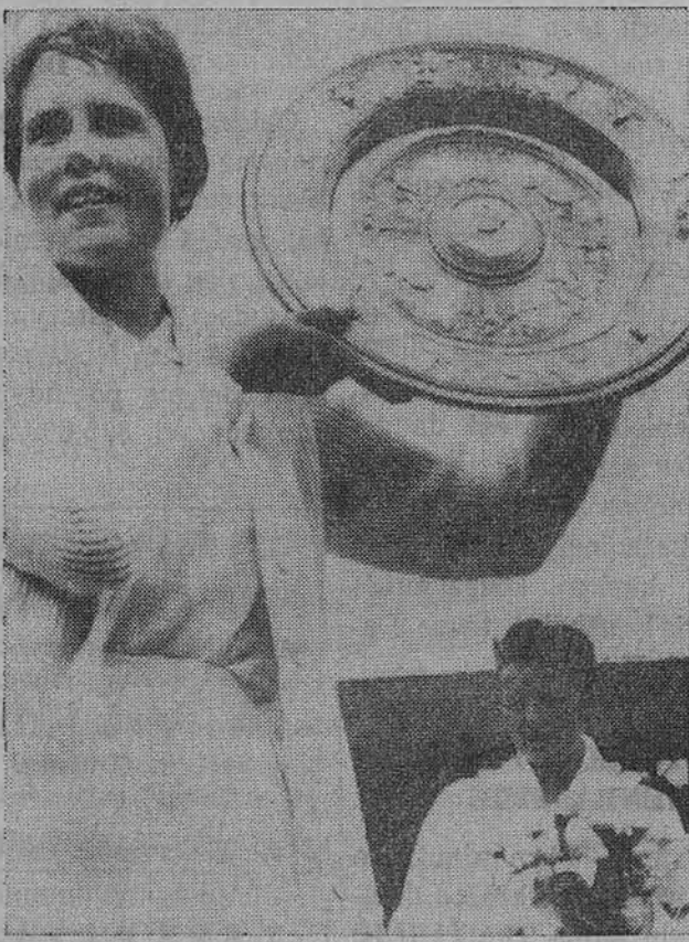
Amerikietė laimė Wimbledon. Mrs. Karen Hantze Guzman, (kairėje), 19 m., iš San Antonio, Tex., laiko laimėtą trofėją. Ji nugalėjo Verą Sukovą (dešinėje), čekoslovakę, tuo laimėdama JAV pavienį žaidimą Wimbledon, kurio paskutinį kartą JAV laimėjo 1958 m.