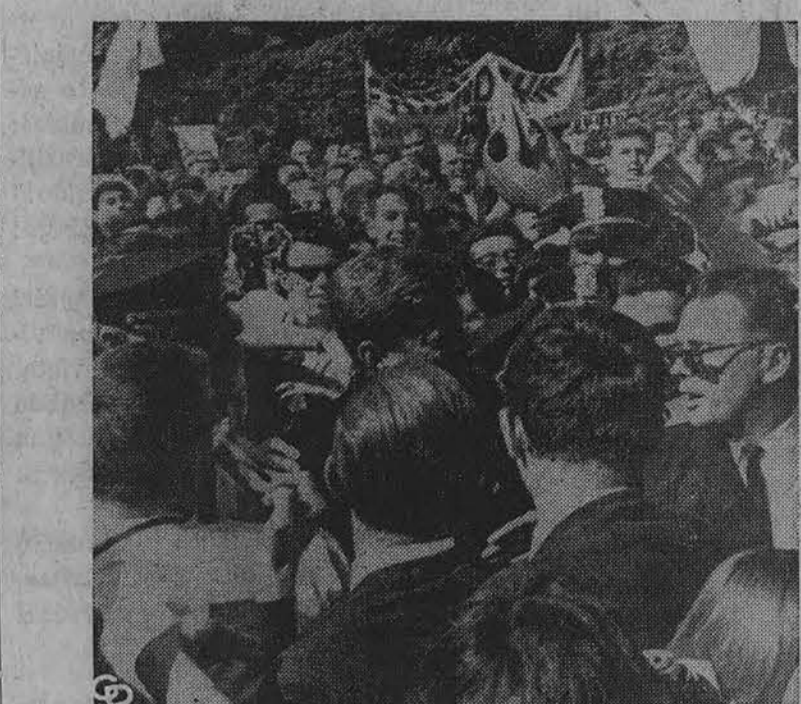
Prez. Kennedy pasakė kalbą 2,000 užsieniečių studentų, kurie yra atvykę į Ameriką vienų metų studijoms. Studentai prasiveržė pro apsaugą ir entuziastingai šaukdami apsupo prezidentą.