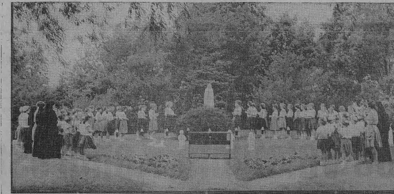
Mergaičių stovyklos dalyvės Putname prie Fatimos Madonos.

Salės atidarymo iškilnių programa: rugp. 10 d. 8 val. v. šokiai, griežiant J. Drumsto orkestrui; rugp. 11 d. 8 val. r. iki 6 val. v. laisvas patalpų apžiūrėjimas ir atsilankiusių vaizdinimas kava bei užkandžiais, 4 val. Liet. veteranų būgnų or-