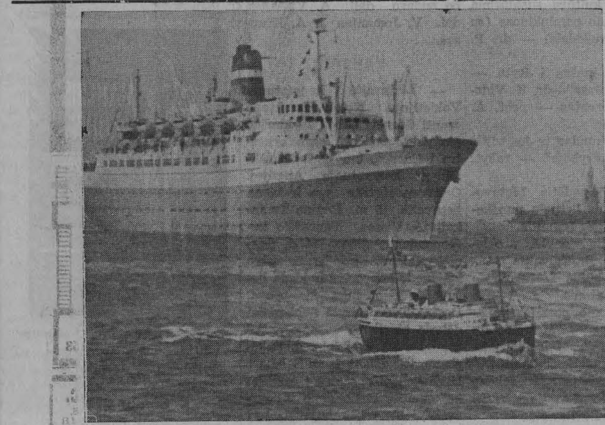
New Yorke uoste didžiulis vandenynų laivas Statedam, prieš kurį 40 pėdų ilgio modelis keleivinio laivo Bremeno, kuris plaukios JAV vandenimis.