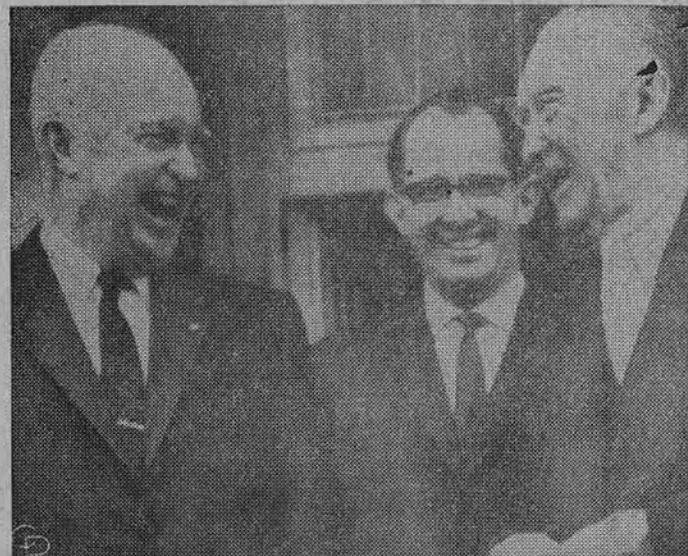
Geroje nuotaikoje — Buvęs prezidentas Eisenhoweris, keliaudamas po Europą, susitiko Bonnoje su Vakarų Vokietijos kancleriu Adenaueriu (kairėje). Vyras, stovįs viduryje, neatpažintas.

— Prancūzija įsitikinusi, jog Britanijai reikalinga laiko įsijungti į Europos Bendrąją Rinką.