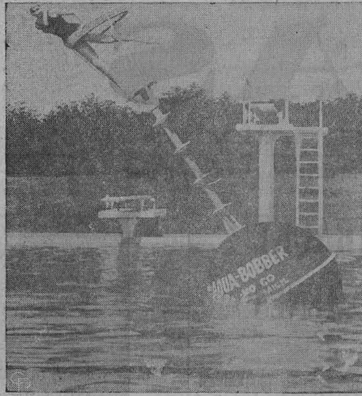
Naujas maudymosi baseino žaidimų įtaisas, pavadintas "Aqua Bobber". Čia 14 pėdų aliuminijaus stiebas įtaisytas 600 svarų kamuolyje, turinčiame skersmenį 5 pėdas ir 8 colius. Kamuolys padarytas iš tirpinto stiklo pluoštų su priemaisimais; viduje yra 2.200 svarų cemento balansui palaikyti. Įlipus į viršų galima gražiai pasitūbuoti į saulį.

Atsakymas O. R. — Ne vien tik saulės spinduliai sendina odą, bet ir nemiga, ir rūpėsčiai, ir skausmai ir t. t.