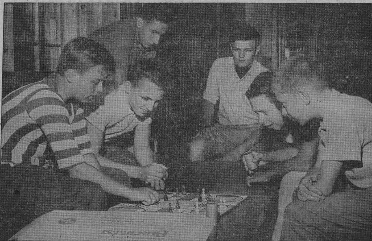
Kennebunk Porto stovyklautojai vieni žaidžia, o kiti stebi ėjimus.