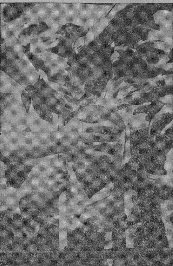
Bangkoke, Tailande, berniukas labai iš arti norėjo pamatyti ten išstatytą astronauto Glenn kapsulę ir galvą įkišo į virbus. Kiti žiūrovai stengiasi mažąjį smalsuolį išgelbėti.

4192 Archer Avenue / Chicago 32, Illinois Virginia 7-1141