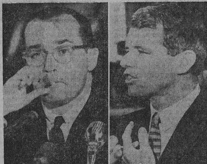
Valstybės teis. sekr. Robert Kennedy (dešinėje) ir susizinojimo komisijos pirm. Newton Minow senato užsienių reikalų komisijoje kalba apie leidimą privačiom imonėm leisti satelitus.