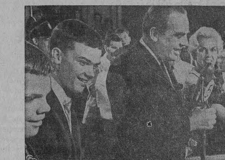
Tennessee valstybės gubernatorium išrinktas demokratas Frank Clement, kuris ėia matomas kalbās Nashville Memorial Square. Pirmą kartą jis ton vieton buvo išrinktas 1952 m., būdamas 32 m. 1956 m. jis buvo pagrindinis kalbėtojas demokratų partijos suvažiavime.

YES For the proposed amendment to Article VI of the Constitution (Judicial Article Amendment). NO