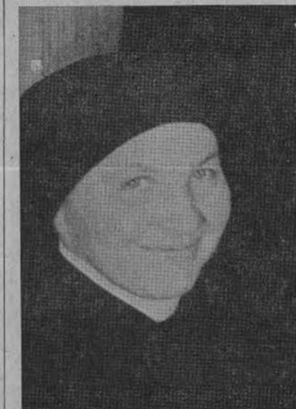
Ses. M. Juozapa

Per tą 25 metų laikotarpį labai daug kas pasauilyje ir Lietuvoje pakito. Ir mūsų minima sukaktvininkė, siekdama die-