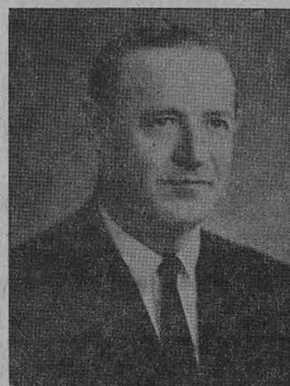
Kongr. John S. Monagan

Pasikalbėjimas su kongresmanu John S. Monagan