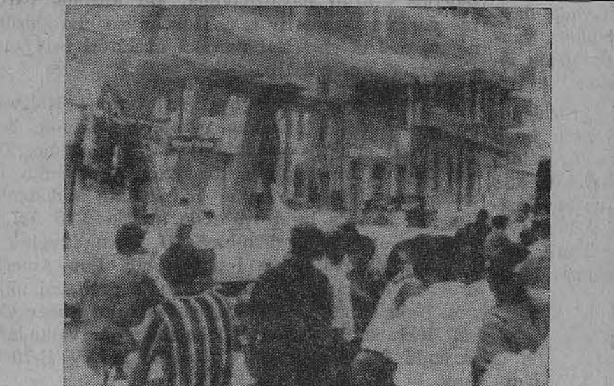
Bari mieste, Italijoje, ugniagesiai stebi žemės drebėjimo padarinius

Visas straipsnis rodo gilią užuojautą ir aukščiausio laipsnio supratimą. Vatikano radi-jas irgi perdavė platų praneši-mą apie tragingą jos mirtį.