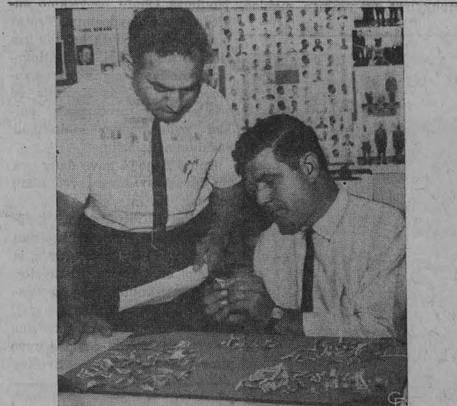
Detektyvai bando sudėti sukarpytus 1 10 ir 20 dol. banknotus, kuriuos kažkas ir nežinia kam paleido iš vieno St. Louis pastato kaip konfeti.

MARLBOROUGH'S LITHUANIAN SELF-TAUGHT, by M. Variakijytė-Inkenienė, išleido Lithuanian Catholic Press Society, Chicago 29, Ill. Antras leidimas. Knyga, padedanti pačiam išmokyti lietuviškai. Chicago, 1958 m. 144 psl. .... $1.25 POPULAR LITHUANIAN RECIPES, compiled by Josephine J. Daužvardis. Antras pataisytas leidimas, išleido Lithuanian Catholic Press Society, Chicago, 1958 m. 128 psl. .... $2.00 JAUNAS AKORDEONISTAS, Povilas Četkauskas. Pradinės akordeonistams žinios ir daugelis melodijų su gaidomis. Išleido J. Karvelis, Chicago, 1958 m. 112 psl. .... $3.00 SVENTOJI VALANDA, Nakties adoracija namuose. Parašė Kun. Mateo Crawley-Boevey, vertė M. Pulauskas, MC. Tėvų Marijonų leidinys, 1958 m. 64 pusl. Kaina .... 25 centai