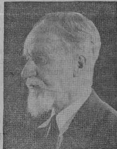
A. a. prof. Mykolas Biržiška