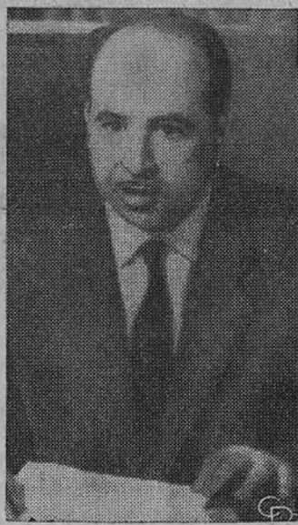
Alžirijos laikinosios vyriausybės premjeras Belcacek Krim pareiškė Alžire korespondentams, kad vicepremjeras Ben Bella nori būti diktatorium.

Iš Kubos daug bėgančių į Jamaiką, kiti išvyksta į Ispaniją, Venecuėlą, o apie 200 kasdien atvyksta į JAV. Visur pabėgėliai labai nuosirdžiai priimami. Bėga uostų darbininkai, kai-