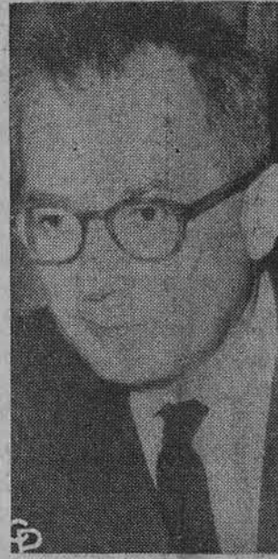
W. Willard W. Wirtz, gimęs De Kalb, Ill., paskirtas JAV darbo sekretorium.

— JAV mokslininkai Darbininkų dienoje (rugsėjo 3 d.) bandys pakreipti raketą Mariner II, kad artėtų prie Veneros.