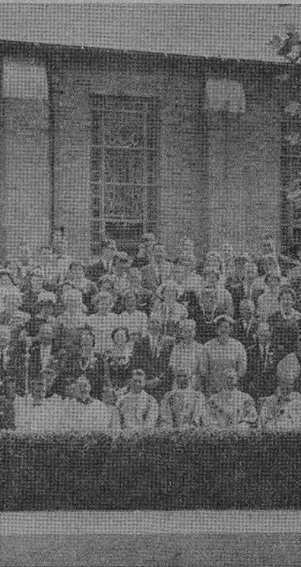
Vyčių seimo, įvykusio rugpiūčio 17-18 d. Newark, N. J., dalyviai.