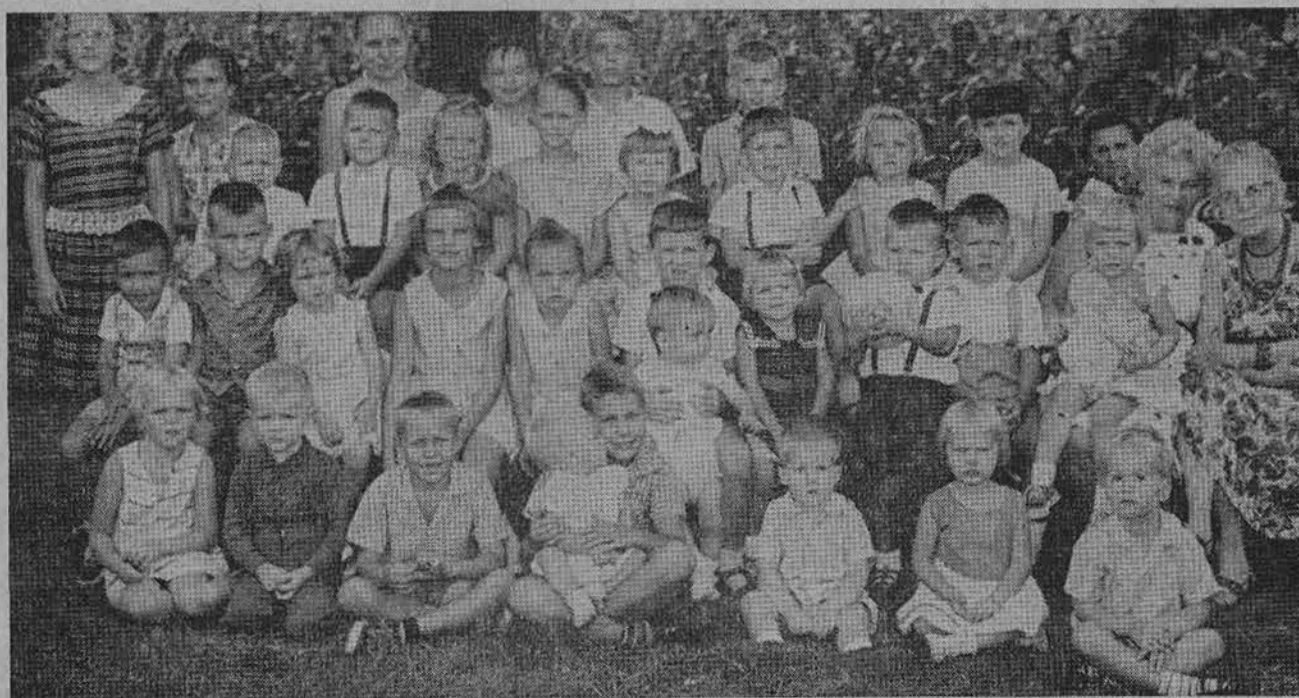
Grupė mažųjų išskylautojų tėvų marijonų seminarijos Montessori dr. Jos surengtoje iškyloje.