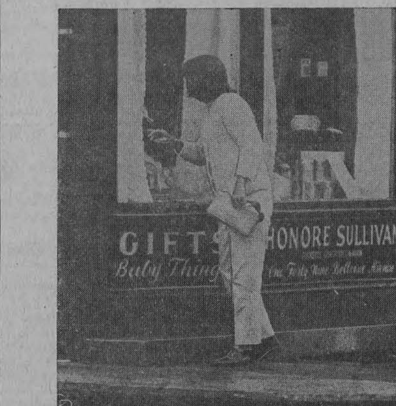
Ne tik eilinės moterys, bet ir turtingo Amerikos prez. Kennedy žmona mėgsta pasižiūrėti ir krautuvijų langus. Čia ji matyti besidairanti Bellevue ave., Newport, R. I.

Sugretinome Kanadą ir JAV. Kanada vis dėlto laimingesnė. Jos lietuvių spaudoj "amerikininio" stiliaus lietuviškos "kritikos" kaip ir nepastebime. Dėl to ten ir kultūrinės šventės, tobulės ar mažiau tobulos, yra daugiau mažiau kritikuojamos šventės. Ten visiška šių švenčių "burbulais" ar "nuliais" neverčia. Ten dirbančiųjų pastangos suprantamos ir pagerbia-