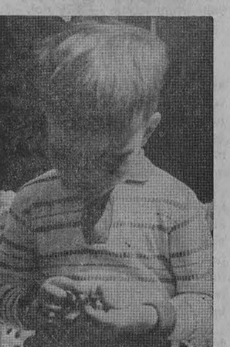
A, B, C — gerai pažįstu, Paskaitau ir parašau.