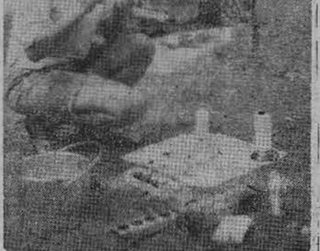
Sesės rengiasi stovyklos atidarymui

— Sol. S. Klimaitė-Pautienė sutiko dalyvauti programoje padainuojant keletą dainų Lituanicos tunto tėvų rengiamame