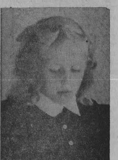
Pirmo skyriaus mokinukas Aš neblogas jau esu.