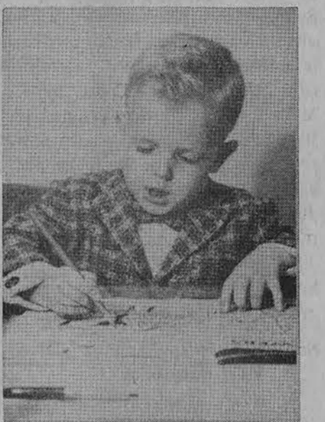
Man pieštukas kaip broliukas, O plunksnelė kaip sesuo.

Su sekančiu numeriu prasidės galvosūkiai su taškais, kurie tęsis iki sekančių metų birželio mėnesio. Daugiausiai taškų laimėję gaus dovanėlių. Taupydami vietą skyriuje, taškų skaičių skelbsime retkarčiais. Patartina kiekvienam turėti sąsiuvinėlius ir rašyti laimėtus taškus.