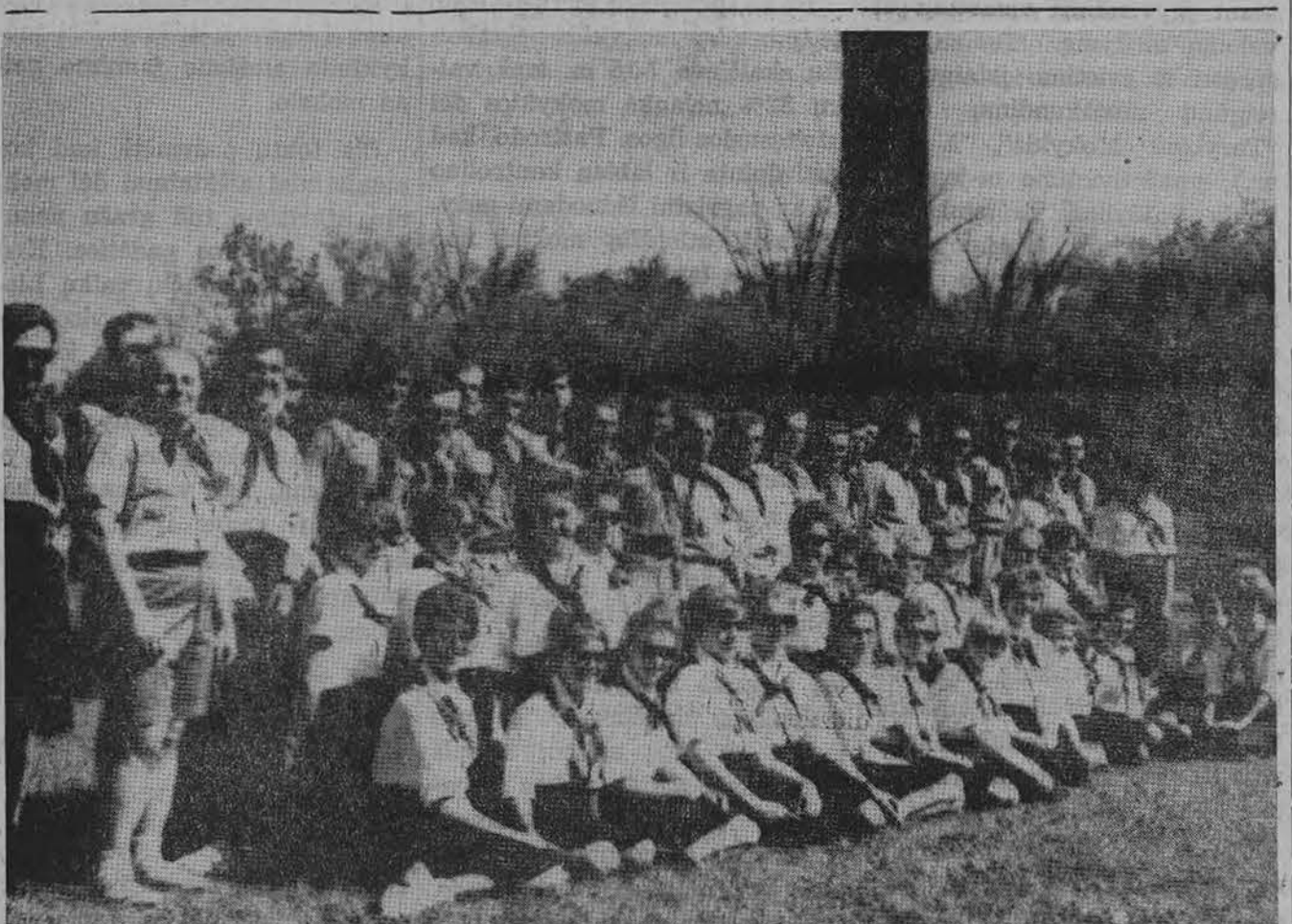
Grupė Akademikų skautų, stovyklavusių XII-je ASS stovykloje Morputh, Ont.