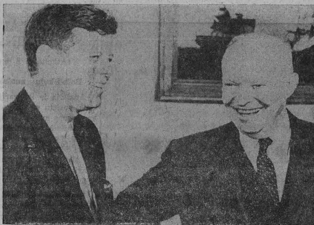
Prezidentas Kennedy sveikina savo pirmtaką, buvusį prezidentą Eisenhowerį, atvykusį jam į Baltuosius Rūmus konferencijai su prezidentu. Prezidentas Kennedy ir jo pirmtakas respublikonas kalbėjosi dvi valandas. Kennedy'ui gavus apie Berlyno situaciją pranešimą iš Eisenhowerio, kuris neseniai grįžo iš kelionės Europoje. Iše kalbėjosi ir su Vokietijos vadais.

Keturių slaptosios policijos generacijų auka Matulionis pergyveno keturias Sovietų slaptosios policijos gene-racijas ir trūko dar vienos savai-tės pasiekti penktąją. Ji perse-kiojo jau Lenino čeka ir OGPU, Stalinas jį kankino su NKVD, o Chruščiovas su KPB ir MGB. Po arkivyskupo mirties, į laisvę pra-nė Nukeita | 4 psl.)