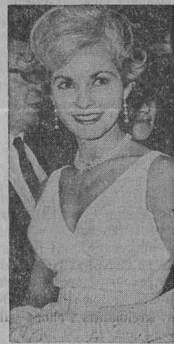
Filmų žvaigždė Janet Leigh, val- dinanti The Manchurian Can- didate filme, lankosi New Yorke.

Tai vis spėliojimai, o mums įdomiau iškelti vokiečių spaud-oje paskelbtą užuominą (pvz. "Frankfurter Allgemeine", 207 nr.), kad visų Vakarų politikų, valdžios vyrų tarpe esą sutar- ta, jog bent šiuo laikotarpiu Va- karai turį atsisakyti paliesti so- vietų viešpatavimo sferą ar sri- tis. O jei kalbėti apie taiką pa- saulyje, tai čia, girdi, esama vie- no pavojaus — Vakarų valsty- bės neturinčios būti silpnos, nei parodyti to silpnumo žymių. Juk sovietai tik ir telaukia, kad pa- sigrobus Berlyną be karo rizi- kos. Ir čia tenka atminti, kad pastarieji karai tepasidėdavo tik tuo atveju, kai puolančioji šalis galvodavo, kad priešingoji pusė pakęs įsibrovimą į jos sfer- ą. Jei Vakarai kartais padė- monstruoja savo silpnumą, jiems primintini prez. Roosevelt- to žodžiai ir juos dabar vokie- čiai cituoja, būtent "parodyki- me darbai ar kuo kitu, kas daugiau reiškia kaip paprasti žodžiai..."