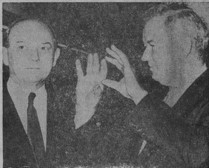
Amerika nebijo — Valstybės sekretorius Rusk (kairėje) kalba su senatorium J. Sparkmanu (D. Ala.) prieš eidamas informuoti Senato užsienio reikalų komisiją apie būsimąją Jungtinių Tautų generalinę ansamblęją. Rusk pareiškė, kad Jungtinės Amerikos Valstybės nebijo Sovietų Sąjungos premjero Chruščiovo grasinimų. Diktatorius Chruščiovas pasakė: jei Amerika kišis į Kubos reikalus, tai ji rizikuoja atomini karą.

WASHINGTON, D.C. — Sir Garfield Barwick, Australijos vidaus reikalų ministeris, lankėsi rugsėjo 10 dieną Baltuosiuose Rūmuose pas prezidentą Kennedį. Jis pareiškė, jog jie svarstė daug dalykų, bet nepasakė kokių.