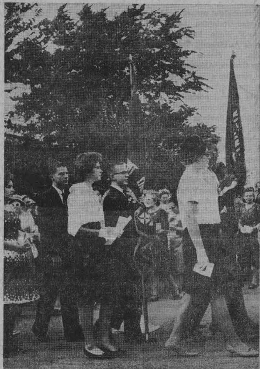
Marquette Parke, Chicagoj, rugsėjo 9 d. įvykusių Šiluvos atleidų procesijos metu žygiuoja ateitininkai. (Nour: Z. Degučio).

Vienas didžiausių statybos darbų negalavimų, tai gerų įrankių stoka. Pasirodo, paties statybos ministro žodžiais, tų įrankių gamybos Lietuvoje niekas nekoordinuoja, jų rinkinys nepakankamas, įrankiai gaminami pagal atskirų įmonių norą, o kokybė — labai žema. Ir kas gi paisrodo? Statybininkai, maty-