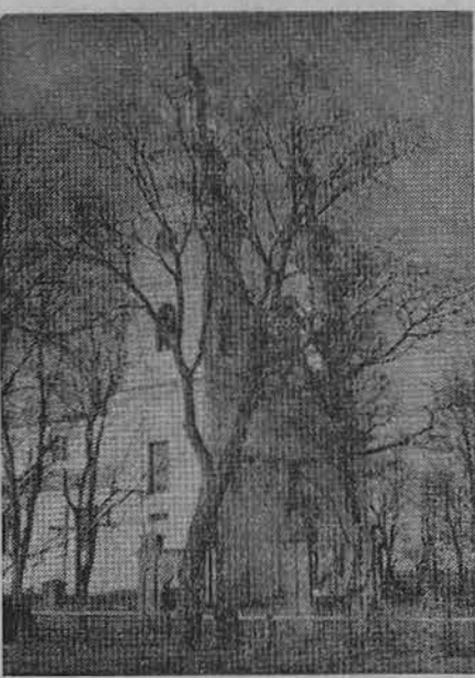
Zemaičių Kalvarijos bažnyčia. Zem. Kalvarijos kaimo koplyčios neseniai buvo bolševikų apipilės- tos.