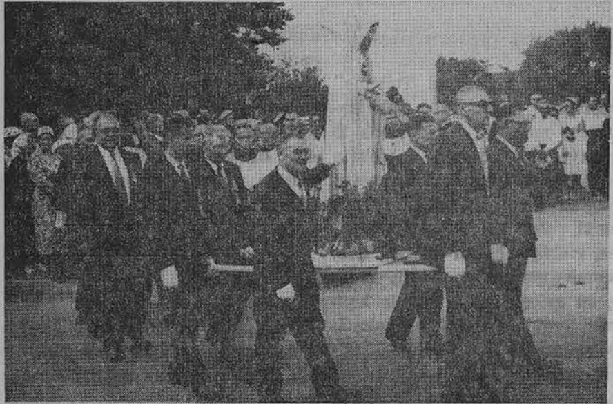
Siluvos procesijos metu Chicagoje Marquette Parke Sv. Vardo dr-jos vyrai neša Marijos statulą. Procesija įvyko praėjusį sekmadienį, rugsėjo 9 d. (Nuotr. Z. Degučio).