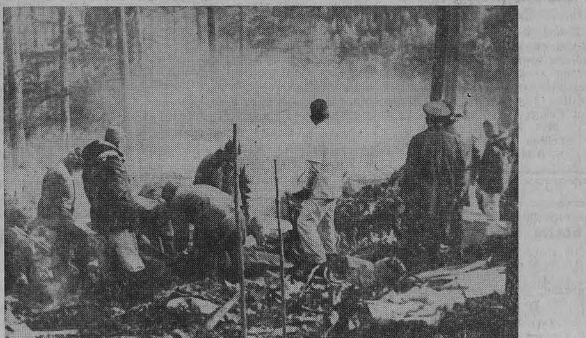
Darbininkai dirba prie nukritusio sprausminio lėktuvo netoli Spokane, Wash. Žuvo 44 vyrai. Lėktuvas skrido į Aliaską ir užkliuvo už kalno viršūnės.