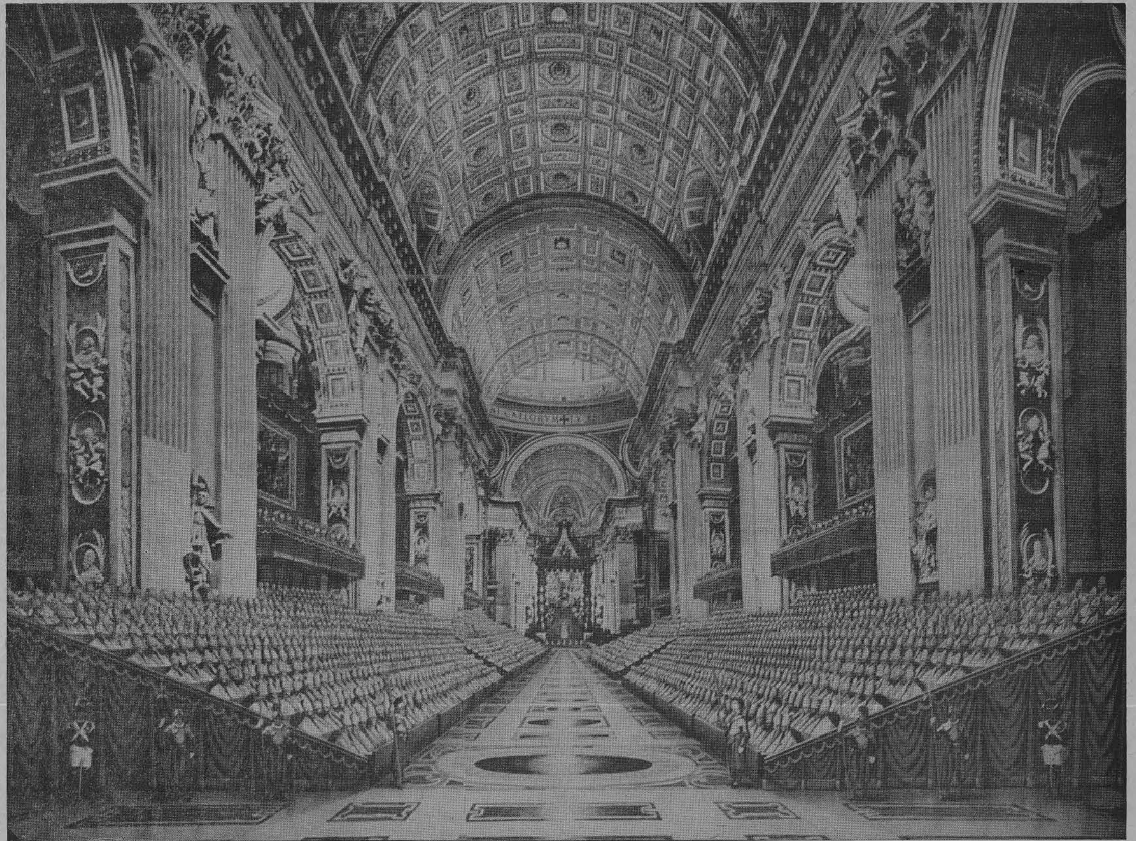
Pagal paskutinius pasiruošimus taip atrodys iškilmingieji II Vatikano visuotinio Bažnyčios susirinkimo posėdžiai Šv. Petro bazilikoje Romoje, dalyvaujant viso pasaulio vyskupams, vienuolių generalams, abatams (2,800 su teise balsuoti dalyviu) ir kitų religijų stebėtojams.

Šv. Tėvo Jono XXIII radijo kalba, pasakyta rugs. 11 d. prieš visuotinį Bažnyčios susirinkimą