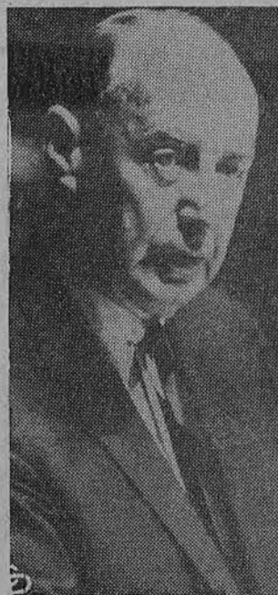
Adlai Stevenson, JAV ambasadorius Jungtinėse Tautose, pasakė ketvirtadienį šioje tarptautinėje organizacijoje politinę kalbą, trumpai priminė šį dalyką: "Kubos vyriausybė, gelbstint moraliai ir materialiai iš lauko, atlieka subversyvinę ir plūdimą agitaciją prieš savo kaimynus vakarų pusrutulyje".

— Argentinos prezidentas Guido, besiginčijant aukštiesiems karškiams, apalpes ir dabar esąs gydytojo priežiūroje. Kai kūrėsi Buenos Aires miesto dalyse vykstančios kovos armijos frakcijų.