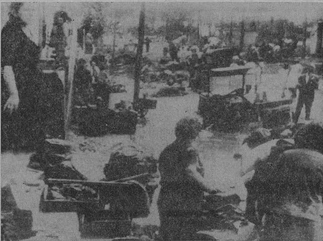
Ispanijoj ištivinus į pietų vakarus nuo Barcelonos upėms, po 8 colių lietaus, žuvo apie 800 asmenų ir padaryta 17 mil. dol. nuostolių. Čia matyti gelbėjimo darbai.

Ir Lietuvoje esą komunistai, nusižiūrėjo į Maskvą, juokda-rius nuduoda. Kas metai Lietu-voje pavergimo sukaktis švenčia ir kasmet skundžiasi nesėkme žemės ūkyje, kitų klaidomis, bet savąsias vengia paminėti, nors esminiai Lietuvos žemės ūkio kurdintojai ir klaidintojai yra komunistai. Jie gali žemdir-bius raginti, kalbėti apie prieš-kinę techniką, net lietuvius ag-ronomus pulti, kai jie nurodė, kad be atitinkamų priemonių per vienerius metus negali pakelti gamybos, bet nesugeba at-sikratyti užpakalinės technikos savo galvoje ir iš pavergtos tau-tos, pavergto žmogaus reika-lauti našumo, lyg iš laisvųjų ūkininkų, kurie neša atsakomy-bę.