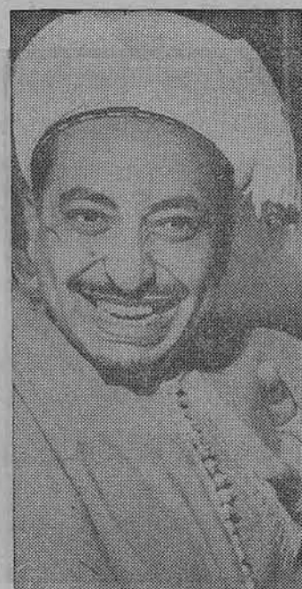
Yemen valstybės radijas praneša, kad revoliucionieriai nužudė karalių El Badr, tik savaitę po to, kaip jis po tėvo mirties pasiskelbė karalium.

— Žinau! Kad šautuvas nelekėtų paskui kulka!