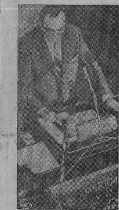
Svarbiausias kalbėtojas — Sakydamas pagrindinę kalbą 44-tame Amerikos legionierių suvažiavime Las Vegas mieste, Nev., J. Edgar Hoover, Federalinės Tyrinėjimo įstaigos (FBI) direktorius, pareiškė, kad legionieriai ir toliau tęsė savo kovą prieš komunizmą, ir ragino "moraliai atbusti kiekvieną namą mūsų krašte".

Pastarąjį argumentą garsino ir Amerikos komunistų laikraštis Worker: "Turite veikti, kad būtų sulaukyta nuo karo prieš Kubą... Karas, kuriuo jie grąsina Kubai, gali atnešti mirtį mums visiems".