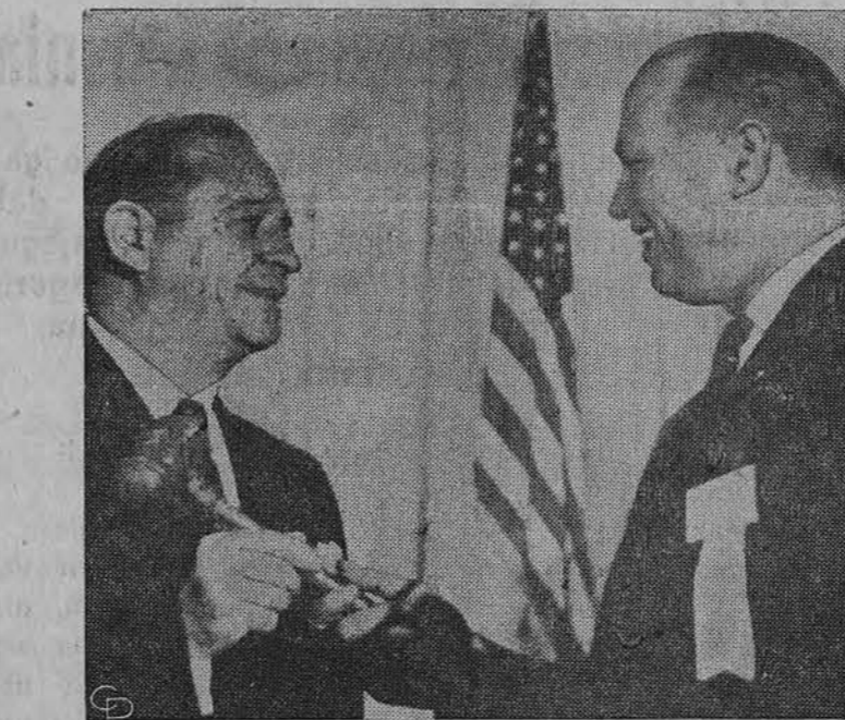
Orval Faubus (kairė). Arkansas gubernatorių konferencijos pirmininkas, prisma pirmininkystės ženklą iš buvusio pirmininko, Tennessee gub. Ellington.

Misija buvo mažiausia penkiolika metų pavėluota. Lietu-