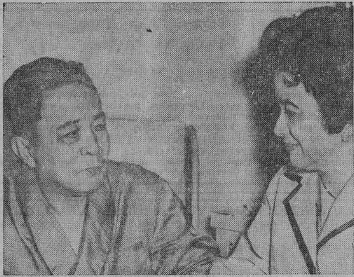
John Hopkins Igoninėj, Baltimore, M. Philipinų valstybės rūmų pirmininkas C. T. Villareal atsigulė sveikatos patikrinimui.