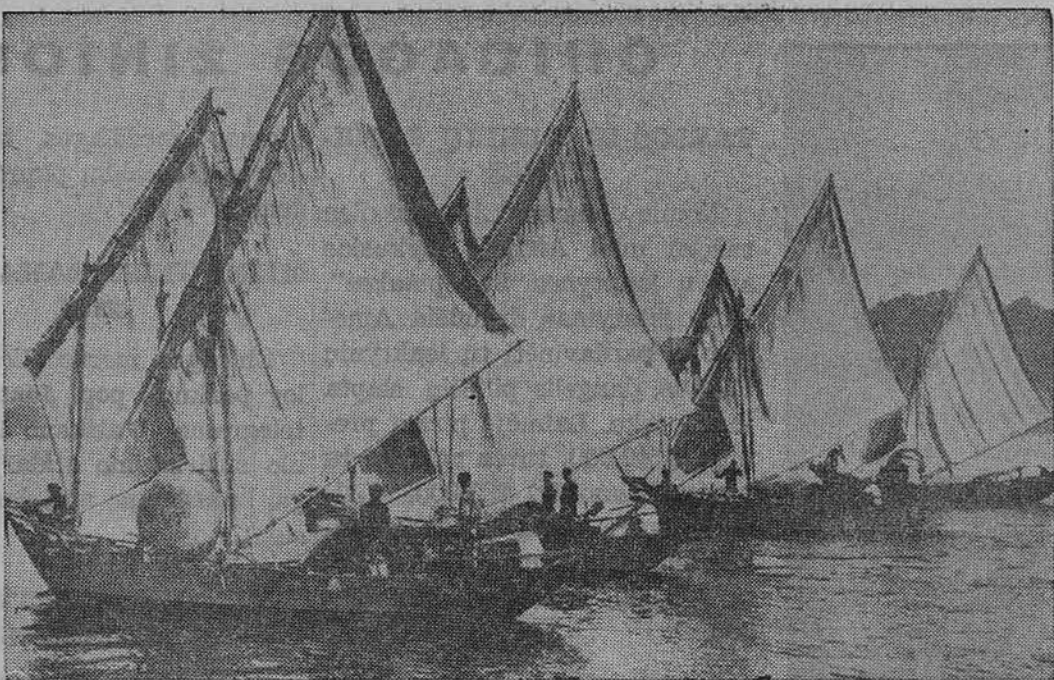
Pietų Vietnamo laivynas pasirengęs kovoti su komunistiniais sukilėliais