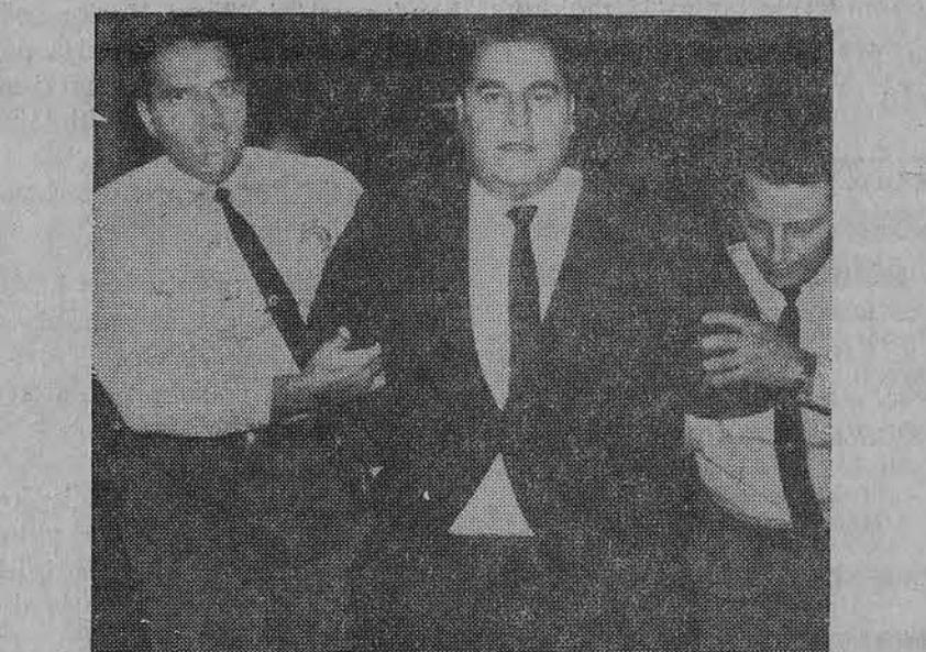
Jungtinių Tautų policininkai išmetė vieną iš daugel kubiečių, diktatoriaus Castro priešų, iš šios tarptautinės organizacijos salės New Yorke, kai jie triukšmu pertraukė Kubos prezidento Osvaldo Dorticos kalbą, raginančią Jungtines Tautas pasmerkti JAV ir prezidentą Kennedį dėl projekto sulaukyti laivus, kurie veža karinius reikmenis į Kubą.

Varžybų įvertinimui sudarytos atskiros komisijos. Rašomieji darbai, rankdarbiai, fotografijos įteikiamos komisijai dvi savaites prieš varžybas. Lai mėjusieji tose varžybose pirmą ir antrąją vietą gaus dovanų. Laimėtojų pasirodymai ir