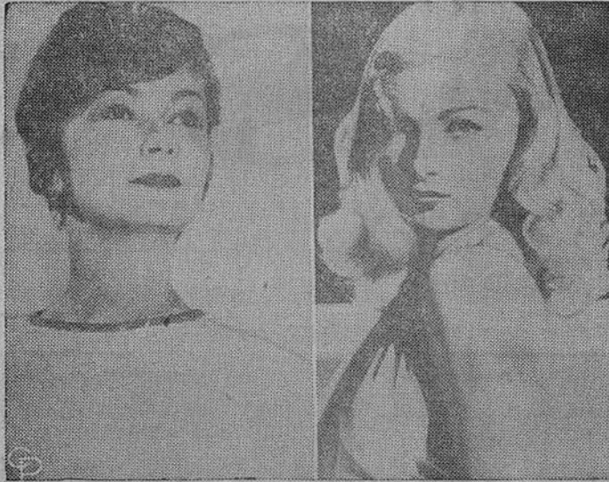
Aktorė Veronika Lake, 42 m., šiuo metu jau tapusi močiute, žada pradėti vaidinti, tik dabar televizijoje. Kairėje pavaizduota, kaip ji atrodė dabar ir dešinėje, kaip ji atrodė 1940 m. filme "I Wanted Wings".

Kl. 1950 m. pasiskoliniau iš savo giminės 1,000 dol. ir pasirašiau tai sumai raštelį su vienu metų terminu. Nustatytu laiku skolą gražinau, bet raštelio atgal negavau, nes mano giminė pasakė, kad raštelį pameš. Ar gali jis iš manęs skolą išreikalauti antrą kartą? Nuo pasiskolinimo ir skolos gražini-