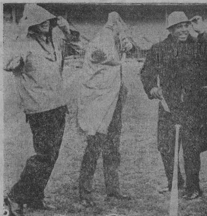
San Francisco beisbolo komandos žaidėjai žiūri į aikštę, kuri patvino be pertraukos lijtant Vakar jau galėjo New Yorko ir San Francisco komandos žaisti tolimesnes World Series rungtynes.

Jau 10 metų, kai St. Charles seminarijos Philadelphijoje auklėtiniai veda susirasinėjimus tikėjimo klausimais su įvairiais abejojančiais ir netikinčiais. Į juos, norėdami informaciją apie katalikų tikybą, jau yra kreipęsi 1,200 asmenų.