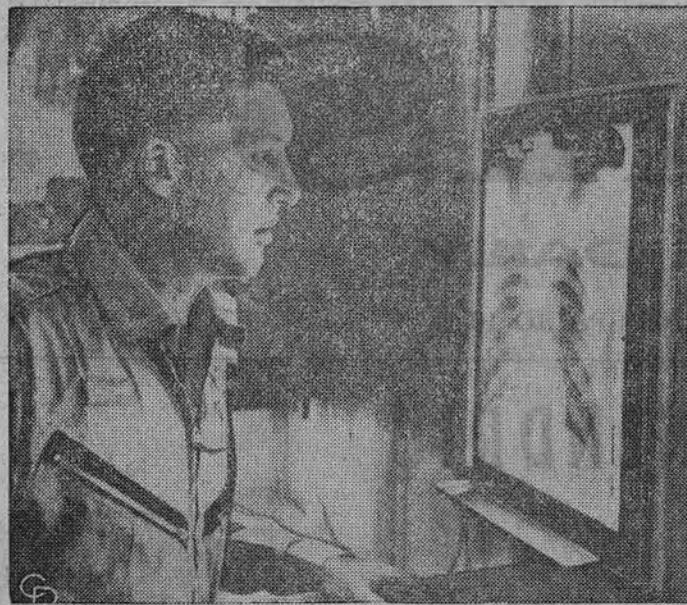
Astronautas Schirra žiūri į savo plaučių nuotrauką, kuri padaryta po jo sėkmingo skridimo apie žemę. Jis čia matyti Kearsarge laive.