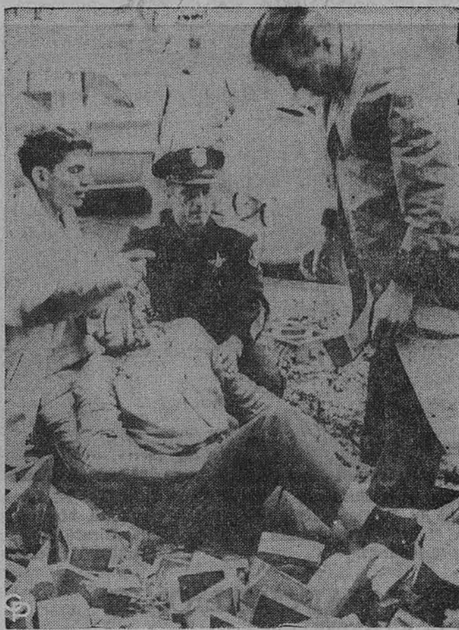
Didelis uraganas pusiaubė Pacifiką ir pareikalavo Californioj, Oregono, Washingtono ir Britų Columbijos valstybėse net 35 žmonių gyvybių. Čia matyti suteikiama pagalba vienam nukentėjusiam.

VISOS PROGRAMOS IŠ WOPA 1490 kil. AM ir 1027 mg. FM Tel. HEmlack 4-2413 7159 So. Maplewood Ave., Chicago 29, Ill.