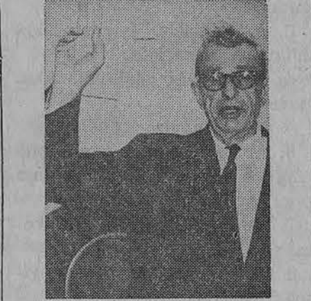
Senatorius Everett M. Dirksen (R., Ill.) kritikavo Kennedžio administraciją dėl "nepakankamos veiklos" Kubos situacijoje.

8 valstybės atstovaujamos Susirinkime dalyvavo Britanijos, Indijos, Olandijos, Vokietijos, Norvegijos, Suomijos, Japonijos ir Jungtinių Amerikos Valstybių atstovai.