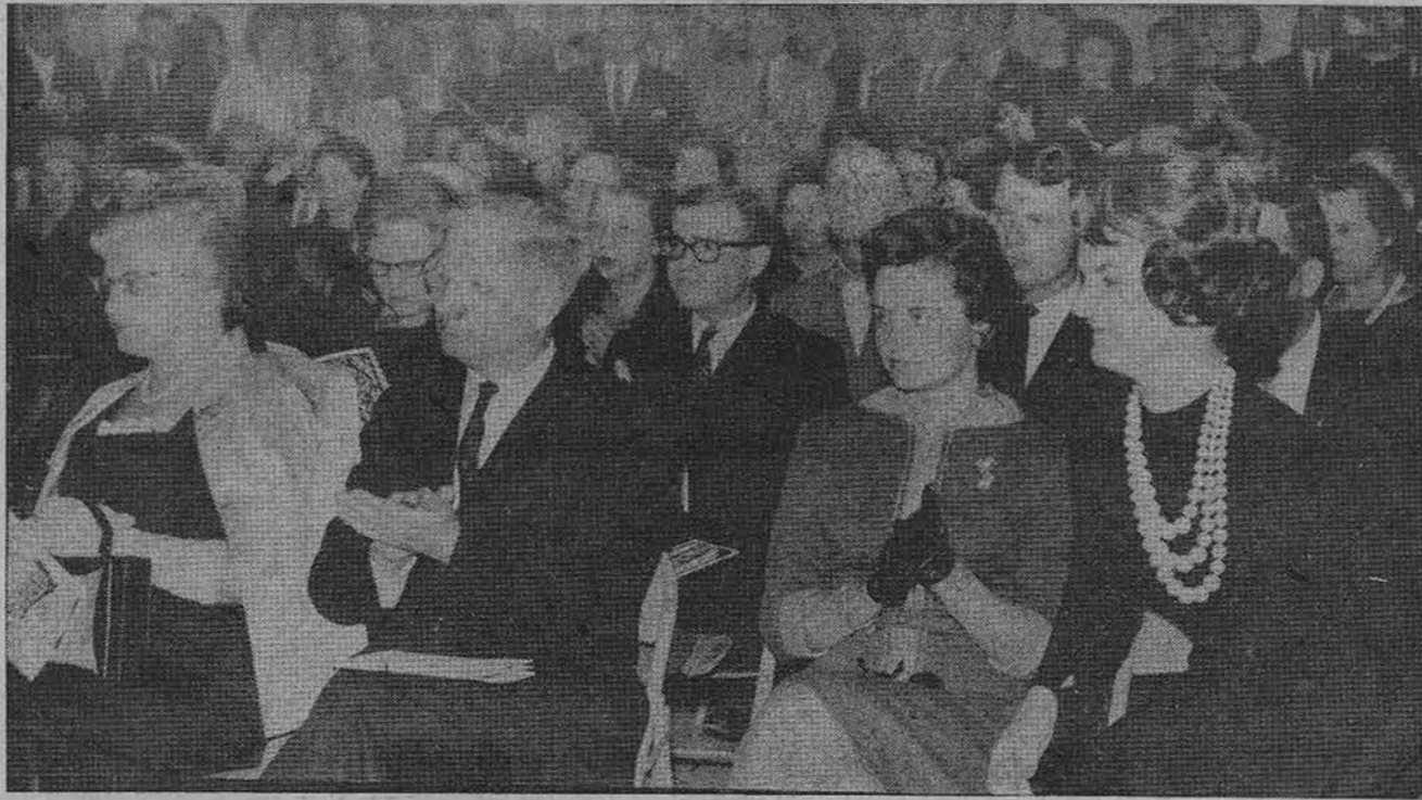
Pakili nuotaka Jaunųjų dailininkų meno parodos atidaryme Čiurlionio galerijoj, Chicagoje.

× Ar Petrauską, ar Stankienę ar Lanžą — ką bemėgintum, visų pokštelės skamba puikiausiai, perduodamos vokišku hi-fi stereo patefonu Telefonen. Pasiklauskyt Gradinsko televizijoj, radijū ir patefonų krautuvėje, 2512 W. 47th St., FR 6-1998. (Sk.)