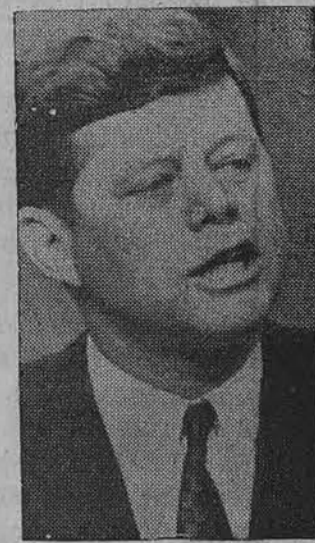
Prezidentas Kennedy vakar Chicagoje pasakė rinkiminę kalbą.

Jungtinės Amerikos Valstybės iš Cape Canaveral, Fla., ketvirtadienį paleido raketą Ranger V į mėnulį. Pradžioje raketa gerai veikė, bet vėliau jos baterijos sugedo. Pasak JAV erdvės įstaisų mokslininkų pranešimo, raketa Ranger V "negalės atlikti skirtų uždavinių". (UPI)