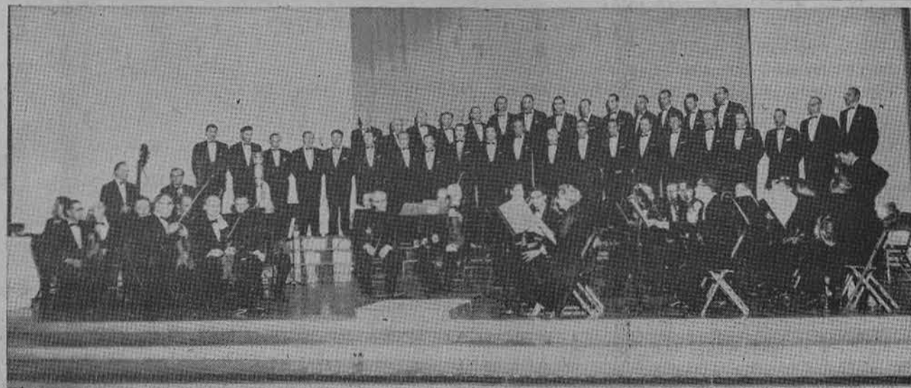
Operos balius, moterų choro penkerių metų dainavimo sukakčiai paminėti, įvyks lapkričio 10 d. 8 val. vak. Western Ballroom salėje. Meninėje programoje dalyvaus ir Vyrų choras, kuris čia matomas vieno savo koncerto metu Chicagoje. Meninė programa bus pradėta lygiai 9 v. vak. (Pr.)