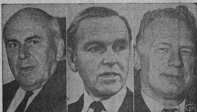
Prezidento Kennedžio komisija — Prezidentas Kennedy paskyrė komisiją, kuri rūpinsis, kad būtų panaikintos sviedinių ugniavietės Kuboje. Iš kairės į dešinę: John McCloy, gynybos vicsekretorius Roswell Gilpatrick ir valstybės vicsekretorius George Ball. McCloy yra Kennedžio nusiginklavimo patarėjas ir dirba kartu su Jungtinių Tautų ambasadorium Stevensonu.

Gen. Lauris Norstad, šiaurės Atlanto organizacijos (Nato) karinių dalinių vyriausias vadas, pasiliks šiame poste iki sausio 1 d., padidėjus pasaulinei įtampai. Jo išėjimas į atsargą buvo numatytas spalio 31 dieną.