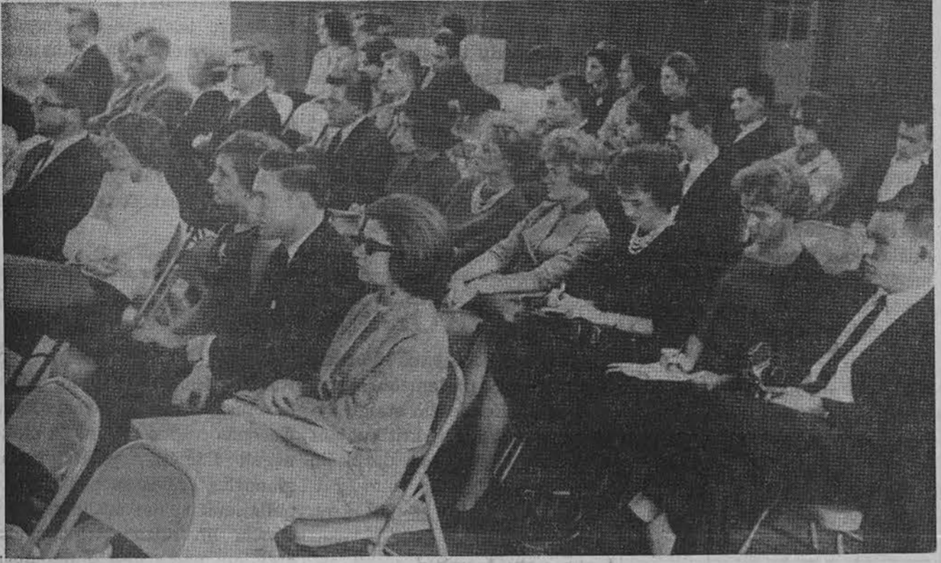
Studentų ateitininkų Studijų dienų New Yorke spalio 12-14 d. dalyviai.

dens nuotaika. Giedrininkės skoningai papuošė stalus spalvotais rudens lapais bei smilgomis. Bufetas traukė akį gardžiai paruoštais valgiais, kuriuos sumėšė pačios sendraugės.