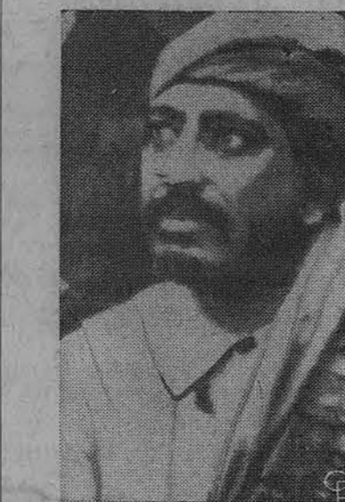
Gyvas ar miręs? — Ši nuotrauka, paskleista Saudi Arabijoje spalio 31 dieną, turi tikslą parodyti, jog Yemeno karalius yra pas genties vyrus šioje arabų pusiasalio valstybėje. Tačiau seniau buvo pranešta, kad jis buvo užmuštas, revoliucionieriams užpuolus jo rūmus rugsėjo 27 dieną.

Oro biuras praneša: Chicagoje ir jos apylinkėse šiandien — apie 40 laipsnių, galimas lietus; rytoj — daugiausiai apsiniaukę, šalta.