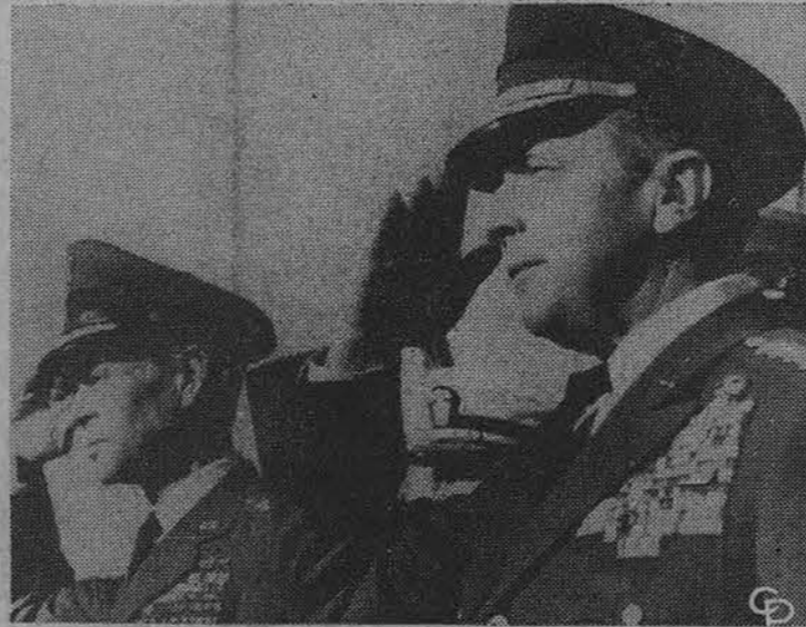
Pasikeičia vadai — Gen. Lyman L. Lemnitzer (dešinėje), naujas JAV kariuolinių dalinių Europoje vyr. vadovas, atiduoda karinę pagarbą, grojant Amerikos himną, kartu su atsargan išsainančiu generolu Lauris Norstad. Gen. Norstad, norėjęs išeiti atsargon lapkričio 1 dieną, pasilikis Šiaurės Atlanto organizacijos (Nato) kariuolinių dalinių Europoje vyr. vadu dar trims mėnesiams, nes pablogėjusi Karaių situacija.