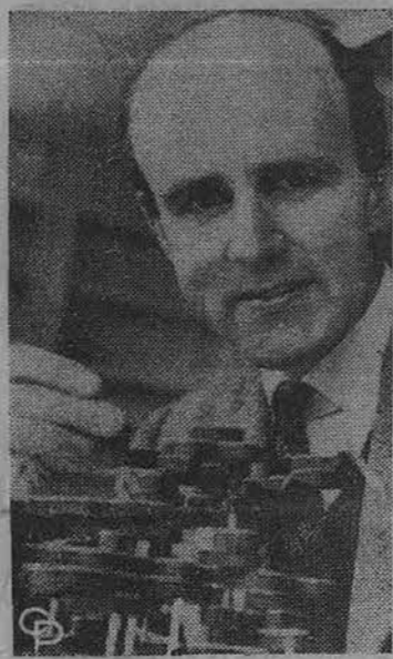
Nobelio chemikas — Dr. Max Perutz, 48 metų, gimusiam Vienoje, išgyvenusiam Anglijoje 20 metų, paskirta chemijos Nobelio premija.

— Pietų Korėjos karinės vyriausybės vadovas gen. Chung Hee Park vakar įsakė areštuoti 278 buvusius politikus, vyriausybės pareigūnus ir namų kontraktorius ryšium su korupcija.