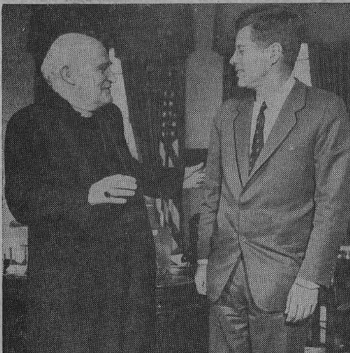
Anglikonų bažnyčios Anglijoje galva A. M. Ramsey buvo priimtas prezidento J. F. Kennedy. A. Ramsey Amerikoje lankosi pirmą kartą.

Vyriausybė likvidavo aliarmą dėl Kubos kompromiso keliu: