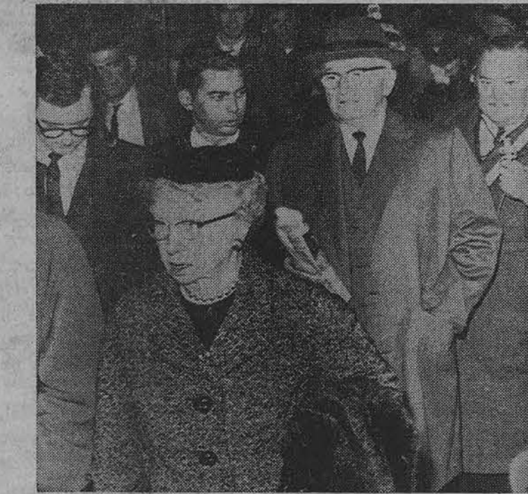
Buvęs prezidentas Harry S. Truman ir jo žmona atvyko į Mrs. Eleanor Roosevelt laidotuves Hyde Park, N. Y. Šiandien laidojama Mrs. Roosevelt.

JAV ambasadorius Sovietų Sąjungoje Foy D. Kohler vakar padėjo vainiką prie vicepremjero Mikojo žonos kars to. Palaidota už Maskvos.