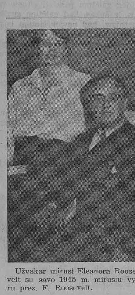
Užvakar mirusi Eleanor Roosevelt su savo 1945 m. mirusiu vyru prez. F. Roosevelt.