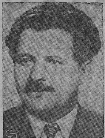
Anton Jugov, Bulgarijos komunistinis premjeras, pašalintas iš savo posto ir centrinio komiteto. Esą jis buvęs stalinistas.