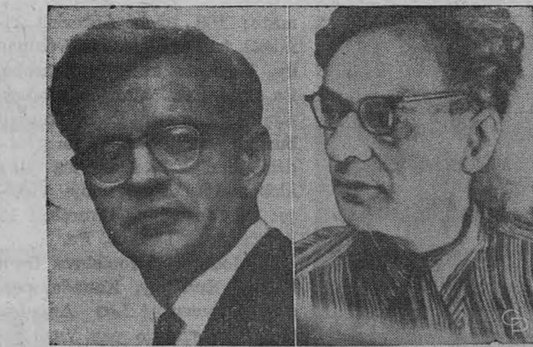
Nobelio premijos laureatai. Kairėje — dr. John Kendrew, Anglijos fizikas, pasidalinęs šiu metų Nobelio fizikos premija su anglu dr. Max F. Perutz už tyrimus hemoglobino ir myoglobino proteinų sudėties. Dešinėje — Sovietų Sąjungos mokslininkas Lev Davidovics Landau, laimėjęs Nobelio chemijos premiją už padarytus heliumo tyrimus labai žemoje temperatūroje.