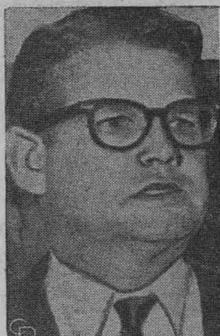
Billie Sol Estes nutėistas kalėti aštuoneriems metams dėl apgaulės.

Žinoma, Klaipėdos gyventojai gerai numano, kodėl Kubai reikiama tiek daug simpatijų ir kokios „laisvės“ režimas šiuo metu viešpatuoja tolimosios Karibų jūros saloje.