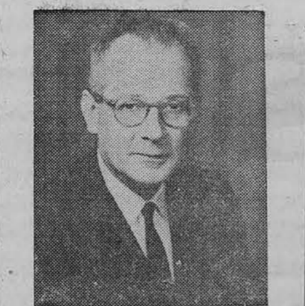
W. WILLARD WIRTZ Naujasis JAV darbo sekretorius

Kl. Daugelis mūsų čia dirbame sezoninius darbus apie 8 mėnesius kiekvienais metais ir tik per tą laiką yra mokami social. draudimo fondui. Per nedarbimus gi mėnesius gauname bedarbių pašalpas. Malonėkite paaiškinti, ar išvedant