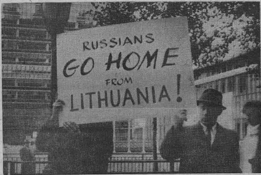
Iš lietuvių demonstracijų New Yorke, lapkričio 4 d., kuriose buvo reikalaujama, kad kruvinasis komunistinis režimas pasitrauktų ne tik iš Kubos, bet iš Lietuvos ir iš visų užgrobtų sričių.

Šauliškas jaunimas su savo vaidinimais ir tautiniais šokiais jau daug kartų aplankė artimesnes ir tolimesnes lietuviškas kolonijas. Tikimasi, kad ši sezoną organizacijos ir vėl kvies jaunuosius lietuviškojo meno puoselėtojus pas juos apsilankyti. Šaulių jaunimas to ir laukia. —av—