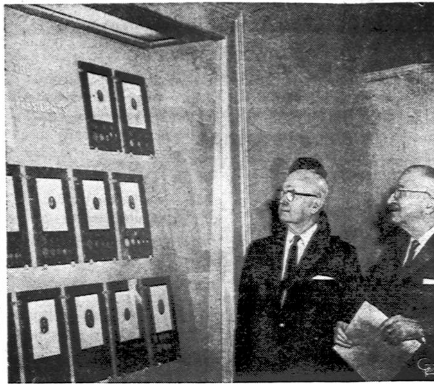
Buv. prez. Trumano bibliotekoje Independence, Mo., padaryta vaizdystė, išnešta rėtų monetų, kurios buvo rinktos 35 prezidentų kadencijų metu. Į monetas žiūri buv. prez. Truman ir buvęs išlo sekret. Snyder.

Dabartinis vidaus reikalų ministras Hoehcherl siūlo sudaryti 11 parlamento narių komisiją, kurios uždavinys būtų sekti vyriausybės veiklą bei išleisti įstatymus, kai Bundestagas negali susirinkti. Šis posūkis neabejotinai sukels audrą parlamente. Piliiečiai jau dabar ima nerimauti.