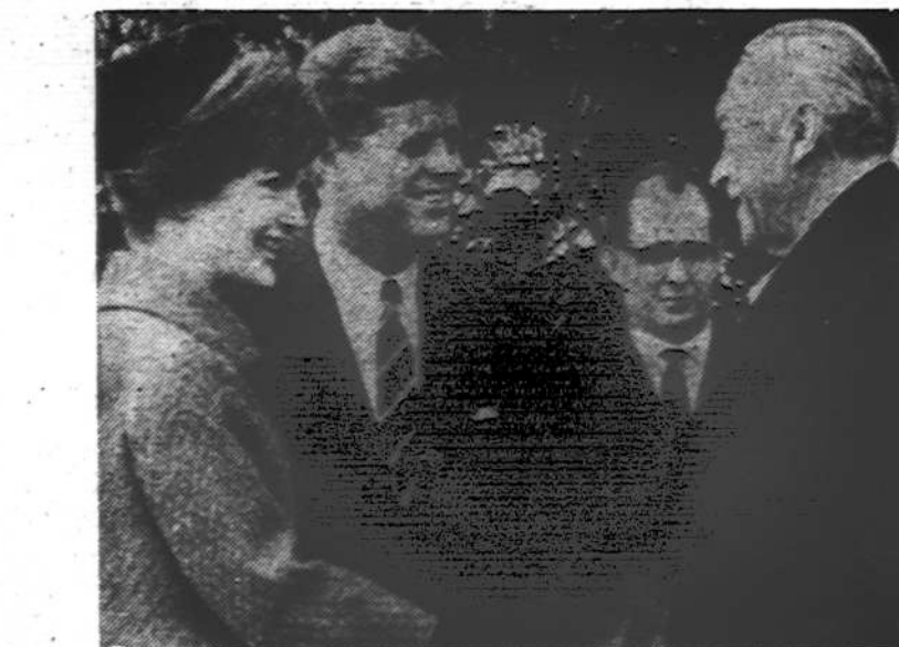
Susitiko spręsti pasaulio įtampan — Vizituojantis dešimtą kartą Ameriką nuo II Pasaulinio karo pabaigos, 86 metų amžiaus Vakarų Vokietijos kancleris Adenaueris sveikinamas prezidento ir Mrs. Kennedy Baltųjų Rūmų aikštėje. Abu vadai vėliau svarstė Berlyno ir kitus šalčio karo įtampos klausimus.