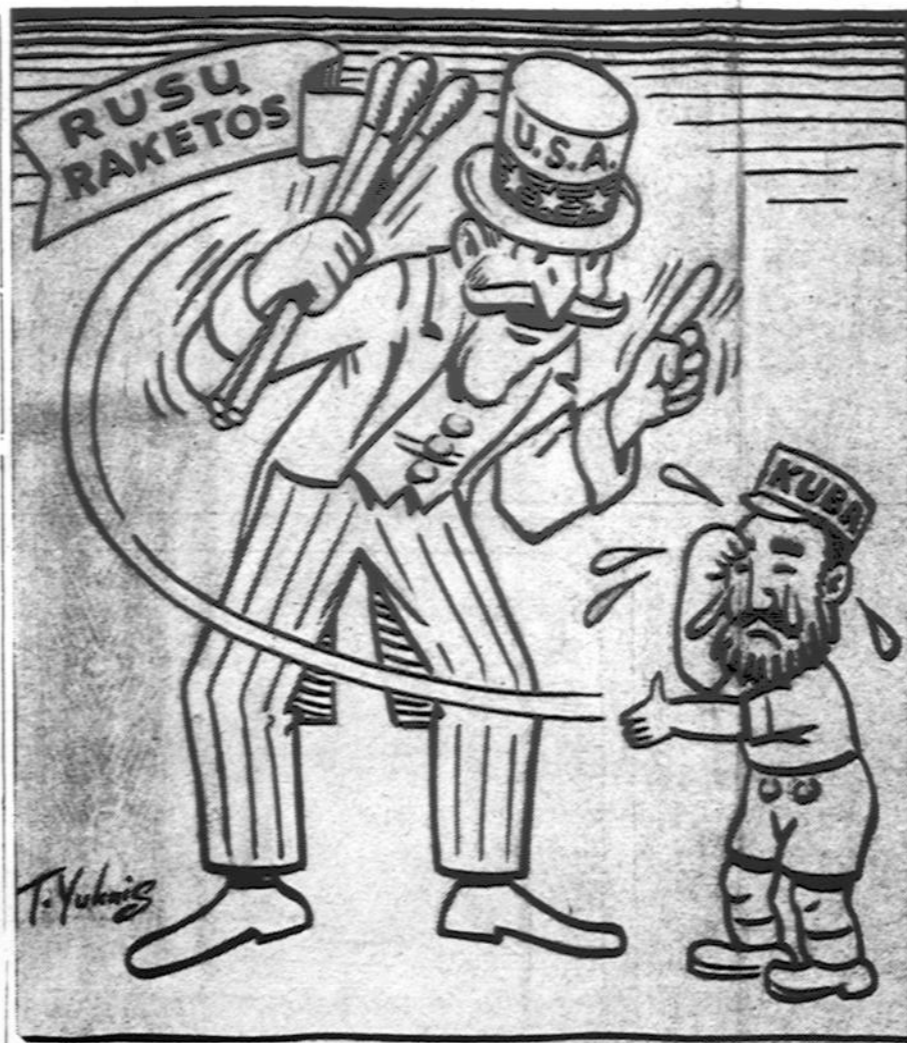
Fidel Castro: "Privertei mano draugą Chruščiovą atsiimti raketas, dabar aš numušiu kiekvieną JAV žvalgybinį lėktuvą, skrendantį virš Kubos."

Herter, 67 metų, buvęs Kongreso narys ir buvęs Massachusetts gubernatorius, turės specialaus atstovo rangą prekybos derybose. Jis planuosias užsienio politiką ir apie savo veiklą tiesiogiai praneš prezidentui.