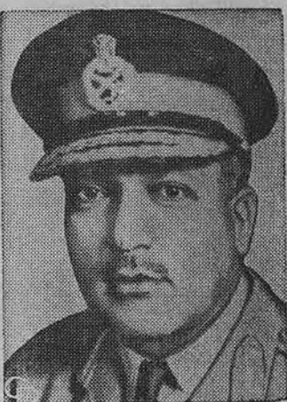
Lt. gen. J. M. Choudhery, naujas Indijos armijos vadas.

— Jungtinių Tautų Saugumo taryboje šią savaitę Jungtinės Amerikos Valstybės, Sovietų Sąjunga ir Kuba bandys išryškinti įvykius Karibuose susitarimo formoje.