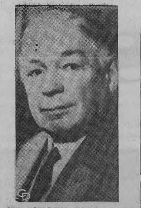
Mirė aluminijaus karalius — Arthur Vining Davis, pagelbėjęs įsteigti Amerikos aluminijaus pramonę ir buvęs vienas Amerikos turtingiausių žmonių, mirė Floridoje. Buvo 95 metų amžiaus.