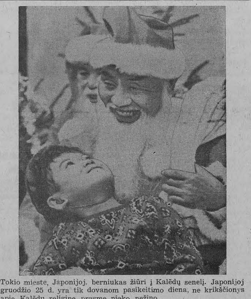
Tokio mieste, Japonijoje, berniukas žiūri į Kalėdų senelį. Japonijoje gruodžio 25 d. yra tik dovanom pasikeitimo diena, ne krikščionys apie Kalėdų religinę prasmę nieko nežino.