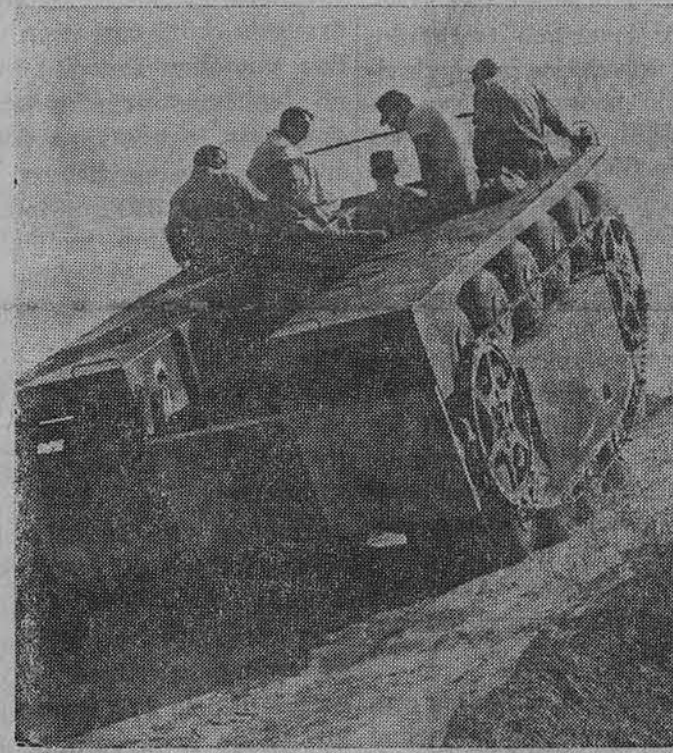
Marinų korpas važiuoja nauju sunkvežimių, kurio ratai vande- nyje padeda sunkvežimiu išsilaikyti ir plaukti vandenui, o sausumoje tie ratai rieda kaip ir visų kitų autovežimiu. Tas puikias padangas pagamino Goodyear bendrovė Akron, O.