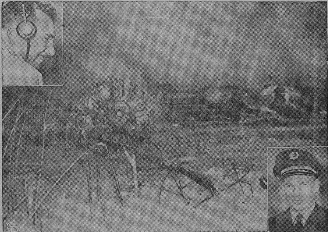
80 ekspertų tirią lėktuvo DC-7B nelaimės priežastį New Yorko Idlewild aerodrome. Nelaimėje žuvo 25 asmenys. Nuotraukoje matyti lėktuvo, skridusio iš Charlotte, N. C., liekanos.