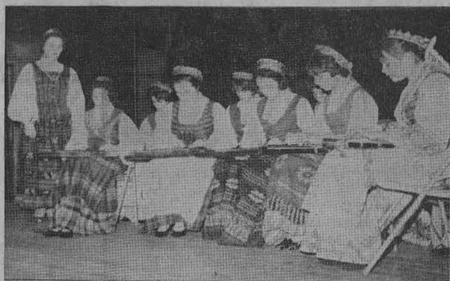
Kanklininkės Jaunimo Centro vakarienės metu

Praeitą sekmadienio vakarą Jaunimo Centre, Chicagoje, suruošta tos įstaigos naujai metinė vakarienė, kurią reikėtų pavadinti reto pasisekimo ir retos nuotaikos pobūviu.