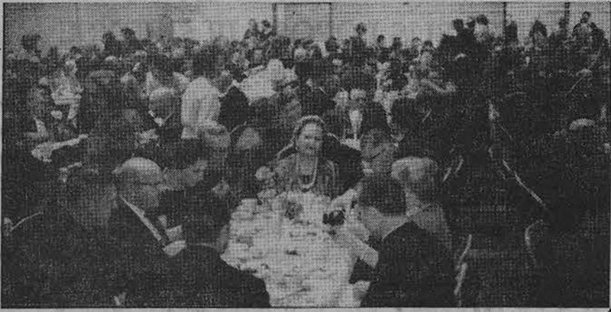
Dalis svečių Jaunimo Centro vakarienėje Chicagoje