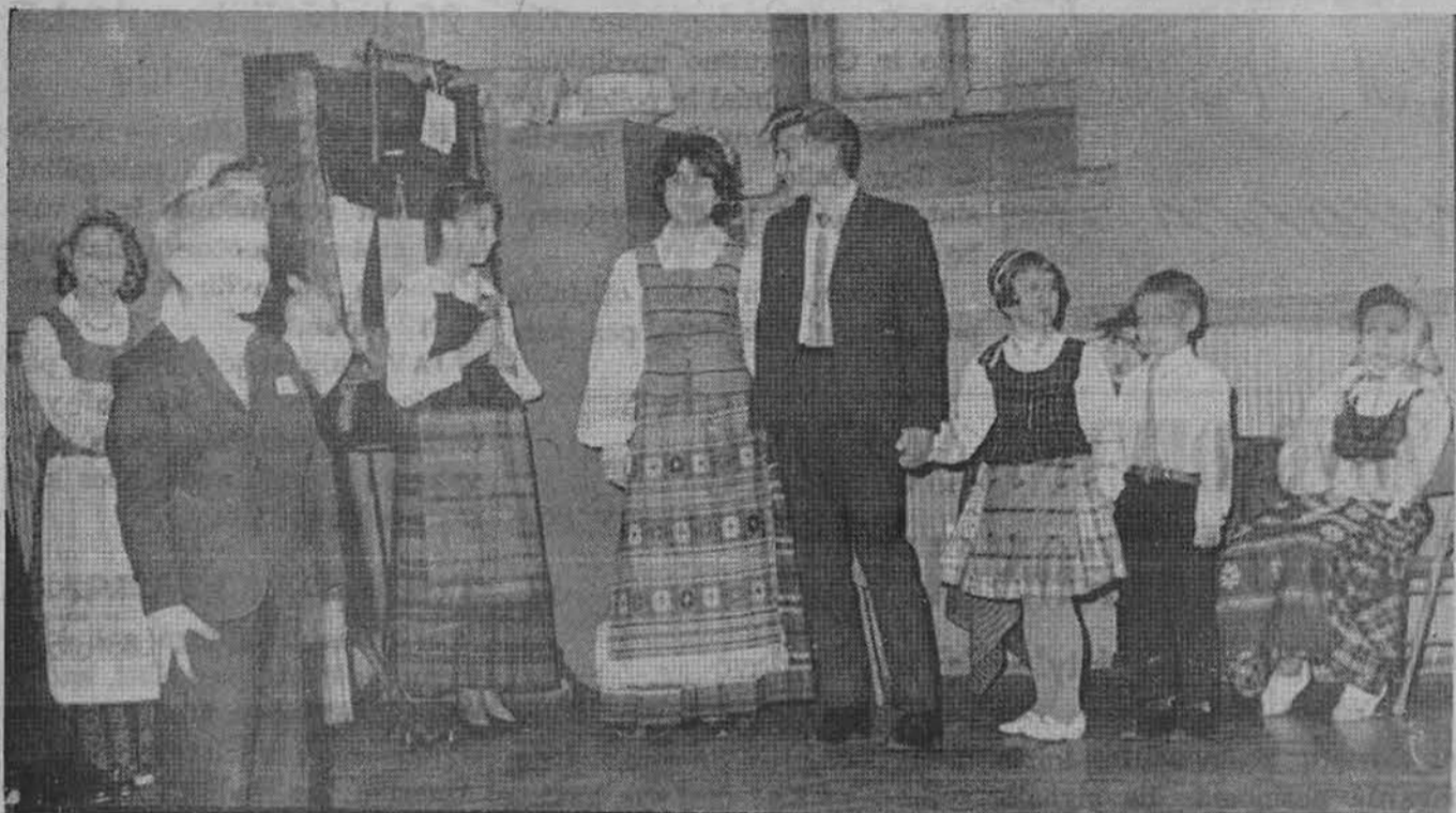
New Yorko moksleiviai ateitininkai atlieka programą Katalikių Moterų sąjungos šventėje lapkričio 4 dieną.

dvasinės vertybės — visuomeniškumą ir pareiškumą. Kuri gi yra lietuvių paskirtis tarp Rytų ir Vakarų kultūrų? Komunizmas lietuvių kultūrą naikina, tad lietuviams, aiškiai su Rytų kultūra nepakeliui, bet ir Vakarai nėra galingingi. Prelegentas priminė krikščionišką humanizmą ir šį kelią rado tinkamiausią lietuviams. Tad, naujai pergyvenant krikščionišką humanizmą, ji per-