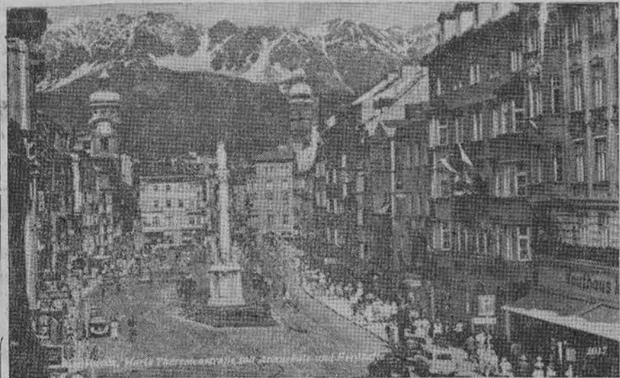
Maria Theresien gatvė Innsbrucke

Praeitis ir vėl atgaivinama. Kaip ir Vienoje, jau patį stotis tarytum sakytų — žmogau, juk jau praslinko 18 metų, gyvenimas negali stovėti vietoje... Ji moderniška, erdvi. Tai didelis skirtumas, kai prisimeni, tuoj karui pasibaigus, matytus griuvėsius čia ar kiek atokiau nuo stoties. Vienas įspėjimas besiskutantiems elektrine ma-