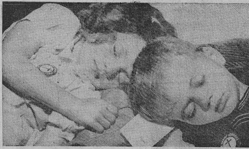
1951 m. liepos 30 d. šią nuotrauką įsidėjo Detroito Times laikraštis, pažymėdamas, kad šie du miegą pabėgėliai yra lietuviai, atvykę į Detroitą. Laikraštis jų vardų neįdėjo ir manoma, kad šie mažieji jau dabar galėtų būti studentai.

× ČIUPA JAUNAMEČIŲ GAUJAS Chicago's policija sučiupo 19-ka narių iš trijų gaujų, besirengiančių į kovą, prie 2450 Rice st. Pas šiuos vaikėzus rasta 11-ka namie gamintų "Molotovo" bombų "kokteilių" ir 8 plytos.