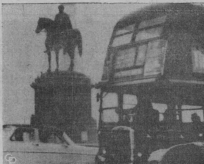
Londoną kankina su dūmais susimaišęs rūkas. Kas valanda dėl to miršta žmogus. Tegalima matyti tik per tris pėdas.

Chicagoje ir priemiesčiuose prie puošnių rezidencijų auga gražių eglių ir pušaičių. Šiomis dienomis nakties metu medeliai buvo nukapati, ir turbūt pašuos kieno namus Kalėdų progai.