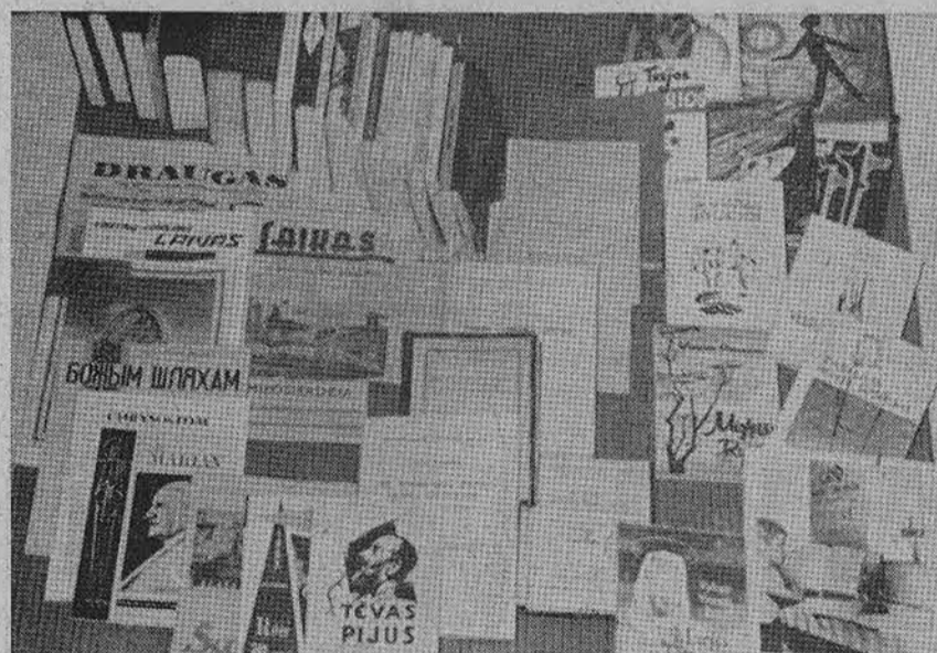
Bažnyčios parodoje Vatikane Marijonų vienuolijos leidinių (paviljone) detalės — nuotrauka.

— Londone dėl didelio rūko (smogo) siautimo nuo pirmadienio mirė daugiau kaip 110 asmenų; 1,000 londoniečių dėl to smogo atsidūrė ligoninėse.