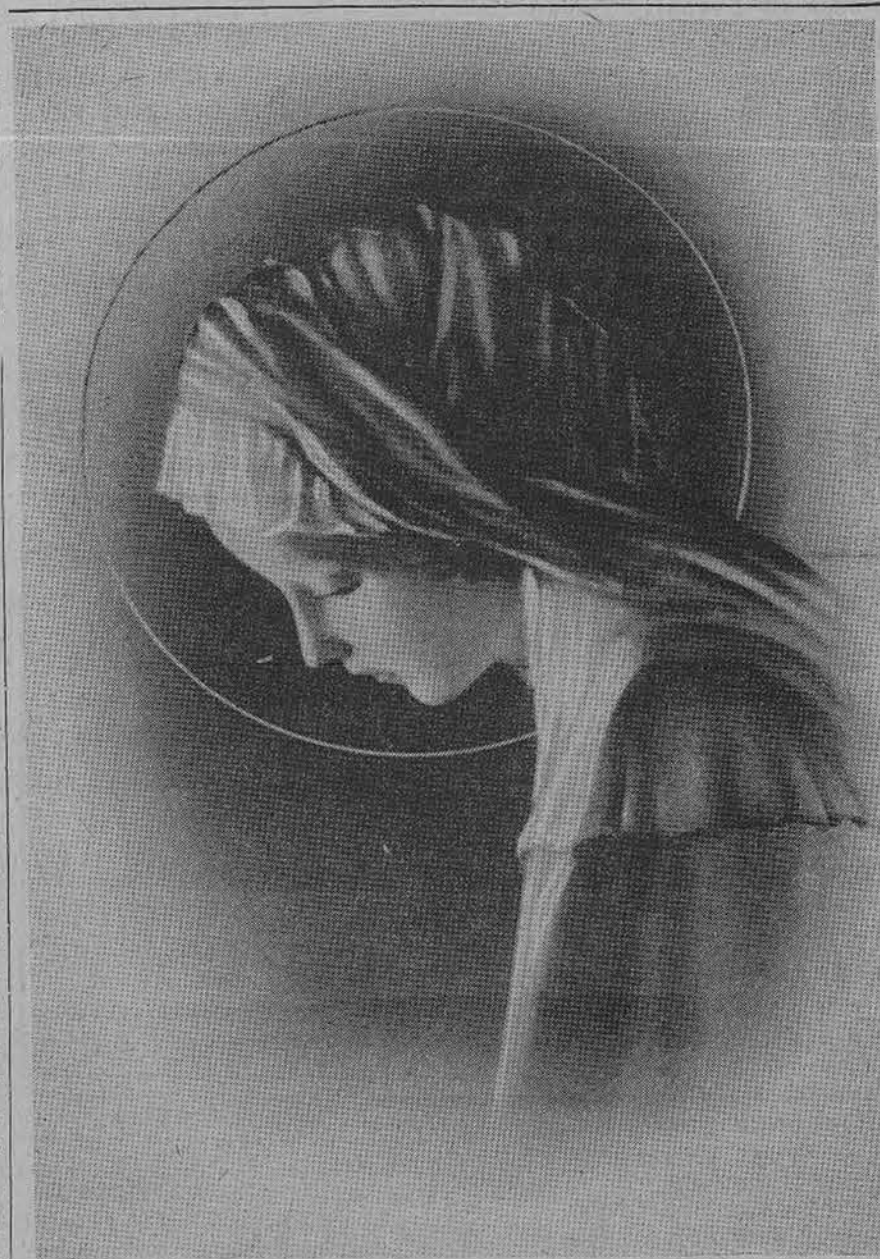
Nekaltai Pradėtoji — Rožė Paslaptingoji

Marija yra visuomet pasiruošusi padėti žmogiškoje istorijoje savo vaikams, nes Ji nori dalyvauti mūsų gyvenime, ir dėlto Jos dvasinė motinystė visuomet yra veikli.