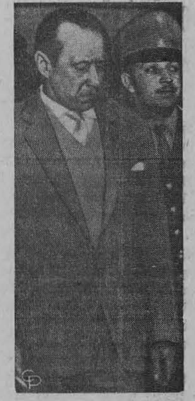
Walter H. Rauf areštuotas Santiago, Čileje, kad jis karo metu dalyvavo 90,000 žydų likvidavime. Rauf teisinasi, kad jis karo metu buvo jūrininkas ir nieko bendro su gestapu neturėjo.