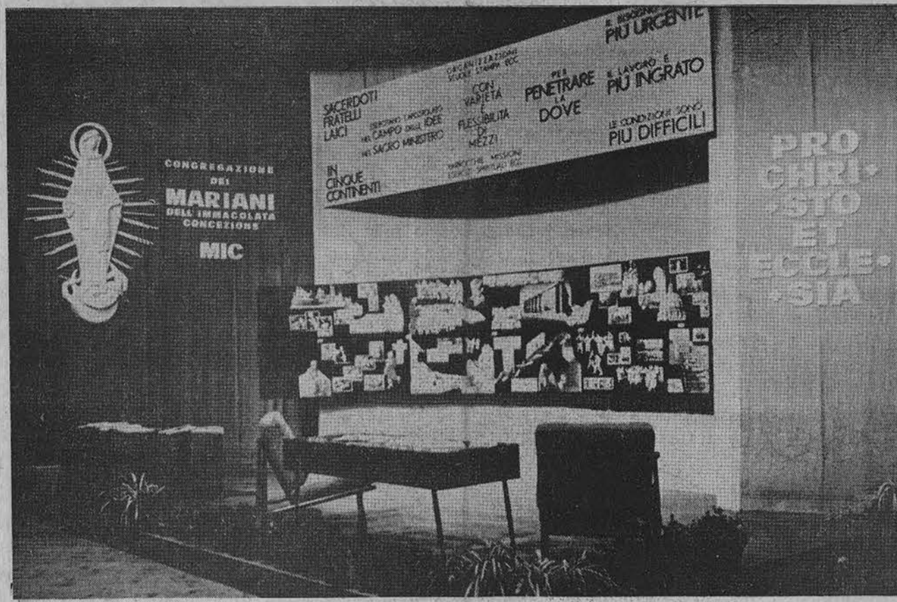
Bažnyčios parodoje (lapkričio 18 d. — gruodžio 9 d.) Vatikane Marijonų vienuolijos paviljonas.