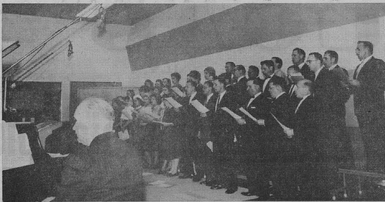
Lietuvos vyčių choras Chicagoje įdainuoja plokštelę