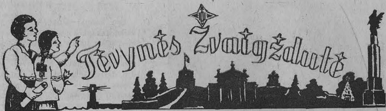
Redaguoja Lietuvių Mokytojų S-gos Chicago sk. redakcinis kolektyvas Red. J. Plačas. Medžiagą siųsti: 7045 So. Claremont Ave., Chicago 36, Illinois

KALĖDINĖMS DOVANOMS: visoks sidabras, porcelanas, kristalas, Hummel ir kt. figūros, gintaras, papuošalai ir brangenybės. paveikslai, lietuviškos knygos, odos dirbiniai, muzikos plokštelės. Kalėdinės atvirutės ir daugybė kitų dalykų puikiu pasirinkimu. — Iki pat Kalėdų paruošimui atdara — kasdien iki 9 v. v., šešt. — iki 6 v. v., sekm. — 12-1 v. v.