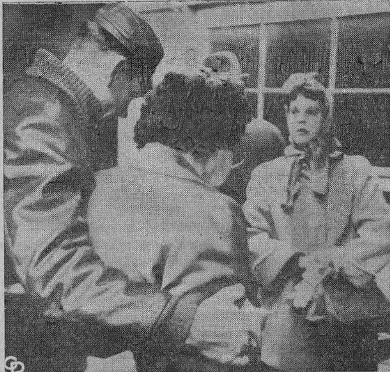
Carmichaels, Pa., anglių kasyklose ištraukė vėl vieną negyvą kašėją. Nuotraukoj matyti žmona ir sūnus, sunkiai pergyveną šią žiaurią žinią.

Reikia lošti iš didžiųjų tikslų ir laimėti Joks svaresnis mūsų viešumos darbas negali apseiti be sąmoningo (tai arčiau tiesos) ar nesąmoningo trukdymo. Idealizmas pakabintas tarp perkreiptų veidų ir įsikarščiavusios burnos neturi juntamos reikšmės. Vyskupas sujungė idealizmą su aiškiu gyvenamojo momento su pratimu, ko mums kaip tik trūksta. Jis išėjo laimėtoju, o mes tik pralaimime. Pralaimime savo jaunąją generaciją ir save pačius. Vyskupas lošė iš religinių ir tautinių principų, o mes šių laikų ženkluose mažai ką susivokiame. Už religinius principus kovoti mes tariamės neturį priešų. Už tautinius tariamės esą kiekvienas sau tauta ir diktatorius. Gyvenimas nėra žaidimas, bet labai rimtas lošimas, neprileidžiant minties, kad didžiųjų siekimu pabaiga būtų tragiška. Toki lošima lošė ir žemaičių a-naštalas. Jis lošė iš katalikybės, lietuvių tautinės sąmonės, švietimo, abstinencijos, išmin-