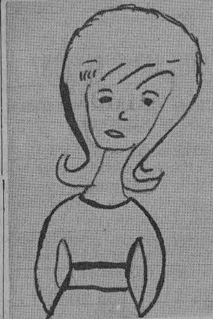
Mano pusseserė. Piešė Aldona Pračkailaitė